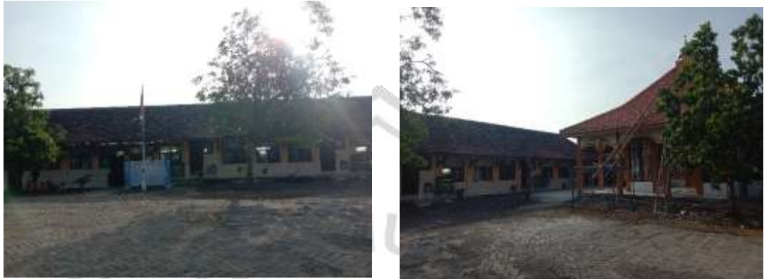
Foto halaman sekolah