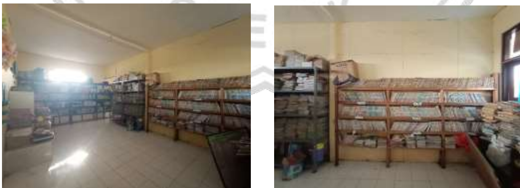
Foto perpustakaan sekolah