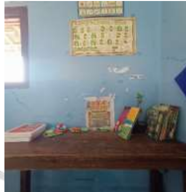
Pojok baca di kelas 3