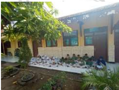
Kegiatan pembiasaan di luar kelas