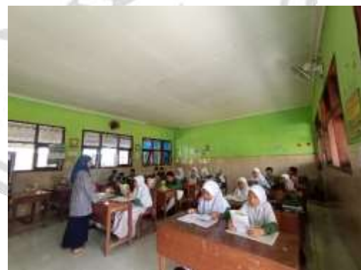
kegiatan pembiasaan di dalam kelas