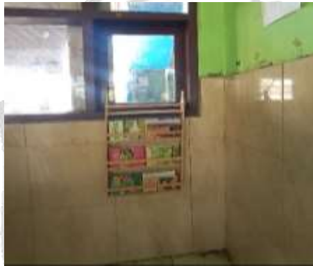
Pojok baca di kelas 5