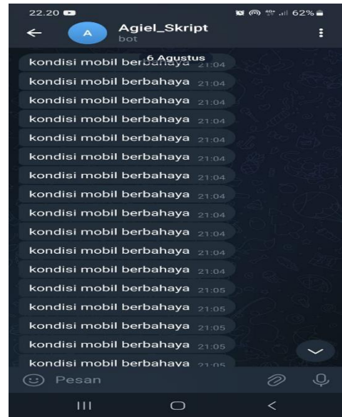
Gambar 4. Tampilan Telegram

Gambar di atas merupakan tampilan notifikasi pesan masuk pada telegram ketika sensor mendeteksi adanya gas beracun berbahaya yang masuk kedalam mobil. Pesan akan terus menerus memberikan informasi jika gas masih dalam keadaan berbahaya.