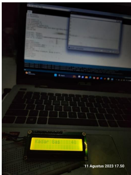
Gambar 3. Tampilan LCD

Dari penelitian yang sudah dilakukan telah berhasil dibuat suatu prototype pendeteksi gas berbahaya di dalam mobil berbasis IoT dengan menggunakan sensor MQ7 dan MQ135. Sensor gas MQ7 memiliki sensitivitas yang lebih tinggi terhadap karbon monoksida dan memiliki stabilitas jangka panjang yang baik.[12] Prinsip kerja dari sensor MQ7 adalah mendeteksi keberadaan gas karbon monoksida. Pada saat terdeteksi gas CO maka resistensi elektrik sensor akan menurun.[13] Sedangkan sensor MQ135 juga dapat mendeteksi gas beracun benzena dimana gas tersebut juga berbahaya bagi kesehatan manusia.[14] Sensor gas MQ135 adalah jenis sensor kimia yang sensitif terhadap senyawa alkohol, benzena dan lain-lain. Sensor ini bekerja dengan cara menerima perubahan nilai resistansi bila terkena gas.[15]