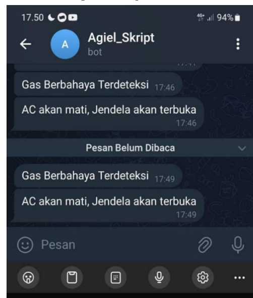
Gambar 5. Tampilan Telegram