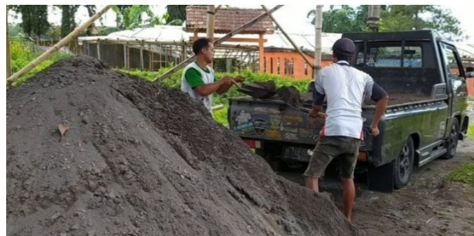
Gambar 2. Proses bongkar muat pasir

Gambar 2, diambil pada saat pengamatan awal, menunjukkan aktivitas fisik yang dilakukan oleh operator bongkar muat persediaan bangunan, salah satunya adalah memindahkan pasir ke pick-up. Prosedur bongkar muat pasir untuk diambil ditunjukkan pada gambar di bawah ini.