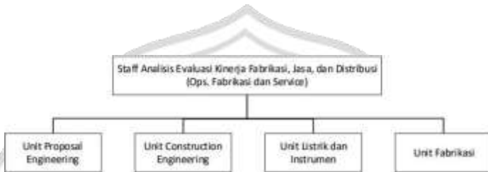
Gambar 2. 3 Struktur Organisasi Pada Workshop Fabrikasi PT. Semen Indonesia Logistik

usaha perdagangan barang industri dan fabrikasi. Adapun struktur organisasi pada Workshop Fabrikasi PT. Semen Indonesia Logistik, sebagai berikut :