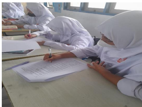
Gambar.2 Penyebaran kuesioner ( pretest )