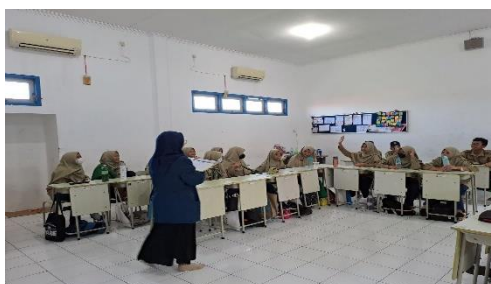
Gambar.1 Pemberian Materi Self Management