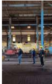
Lampiran 5 Dokumentasi Peneliti Kerja Praktik di PT. Swadaya Graha