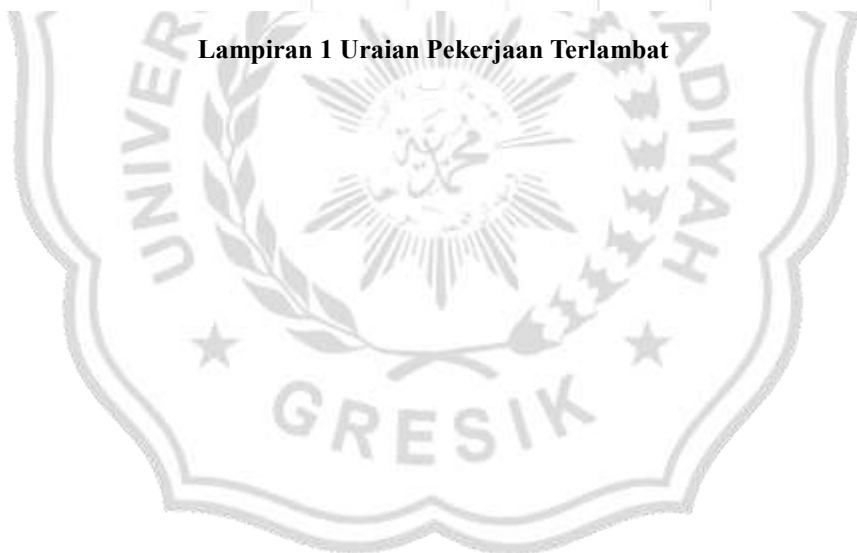
Lampiran 1 Uraian Pekerjaan Terlambat