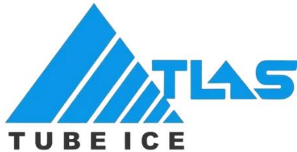
Gambar 3.1 logo PT JATIM ES TUBE