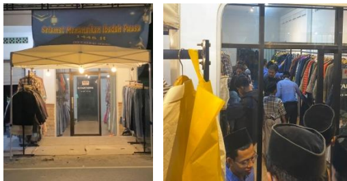
Gambar 2. 11 Pelayanan Outdoor

Dilakukan membuka stand didepan store dengan memberikan harga khusus