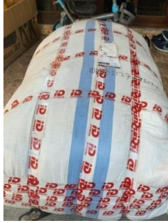
Gambar 2. 12 Restock barang