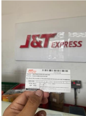
Gambar 2. 5 Pelayanan via online

Pengiriman dilakukan setelah orderan masuk dan langsung diserahkan ke pihak ekspedisi