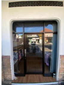
Gambar 2. 2 Toko resmi starters store

Pembelian bisa langsung mengunjungi toko yang berada di Jl. Kh. Syafi'i