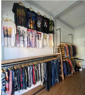
Gambar 2. 3 Strategi layout