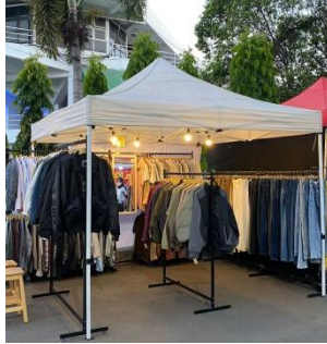
Gambar 2. 10 Event Outdoor