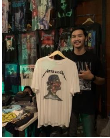
Gambar 2. 8 Event khusus