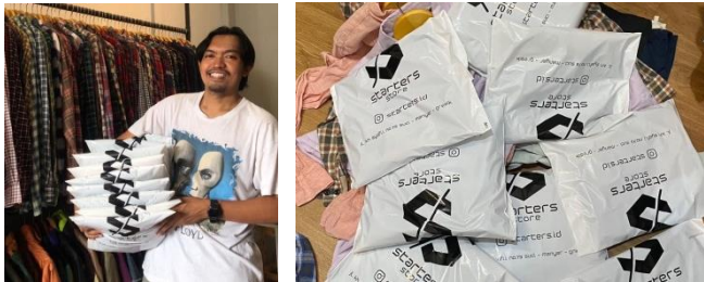
Gambar 2. 7 Apresiasi Owner

Banyaknya produk yang laku selalu dijadikan dokumentasi untuk meyakinkan customer terhadap pelayanan starters