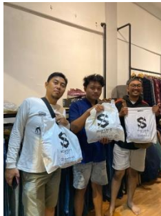
Gambar 2. 9 Apresiasi customer

Bentuk rasa terima kasih starters ke pelanggan setia, dengan upload story ig