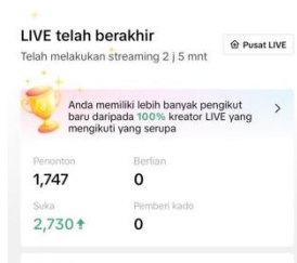
Gambar 2. 4 Pelayanan via aplikasi tiktok

Viewer yang cukup banyak merupakan salah satu strategi owner untuk menarik perhatian pembeli