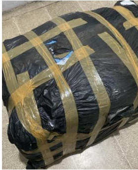
Gambar 2. 6 Pelayanan pembelian grosir