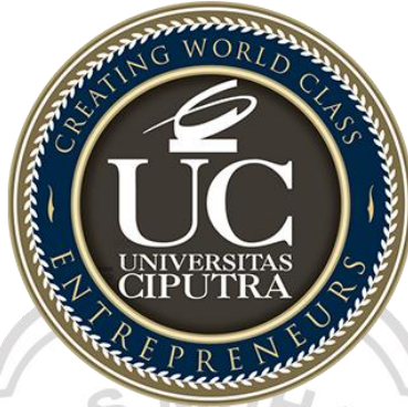
Gambar 2. 3 Logo Universitas Ciputra

Universitas Ciputra (UC) adalah universitas swasta yang berlokasi di UC Town, Citraland, Surabaya, Jawa Timur, didirikan pada tahun 2006 oleh Dr. (HC) Ir. Ciputra. Universitas ini memiliki visi untuk menghasilkan lulusan dengan karakter entrepreneurial dan mindset global, serta misi memberikan pendidikan unggul dalam bidang kewirausahaan.