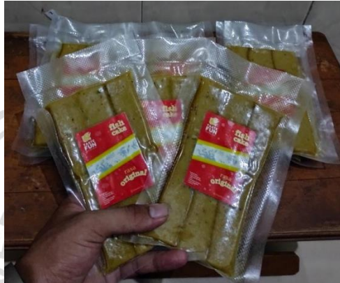
Gambar 2. 5 Produk Fish Cake

beku, terutama produk fish cake. Dengan mengutamakan kualitas bahan baku dan proses produksi yang higienis, perusahaan ini memastikan setiap produk yang dihasilkan memenuhi standar kesehatan dan rasa yang tinggi.