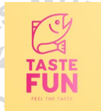
Gambar 2. 4 Logo Perusahaan Taste Fun

Taste Fun didirikan pada tanggal 3 September 2023 dan beroperasi di industri makanan. Fokus utama perusahaan ini adalah memproduksi makanan beku, khususnya fish cake. Sebagai perusahaan yang baru berdiri, Taste Fun berkomitmen untuk menyediakan produk fish cake berkualitas tinggi yang dapat dinikmati oleh berbagai kalangan.