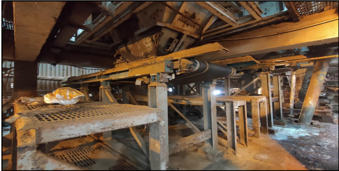
Lampiran 9 Dozometer 18M4102