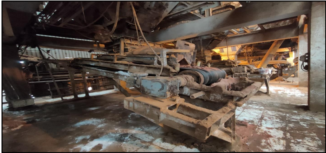
Lampiran 7 Dozometer Area NPK Granulasi IV