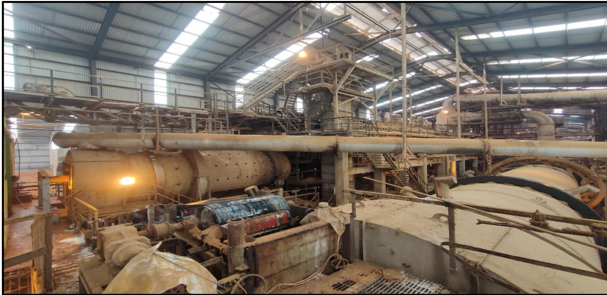
Lampiran 6 Unit NPK Granulasi IV dari sisi Dalam