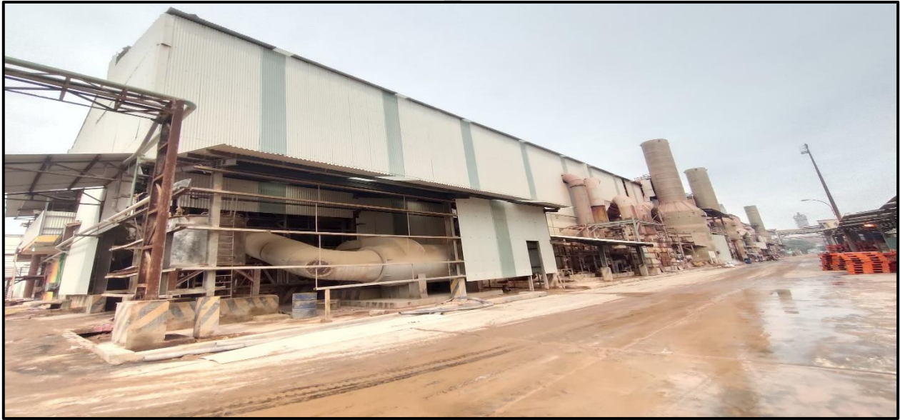
Lampiran 5 Unit NPK Granulasi IV dari sisi luar