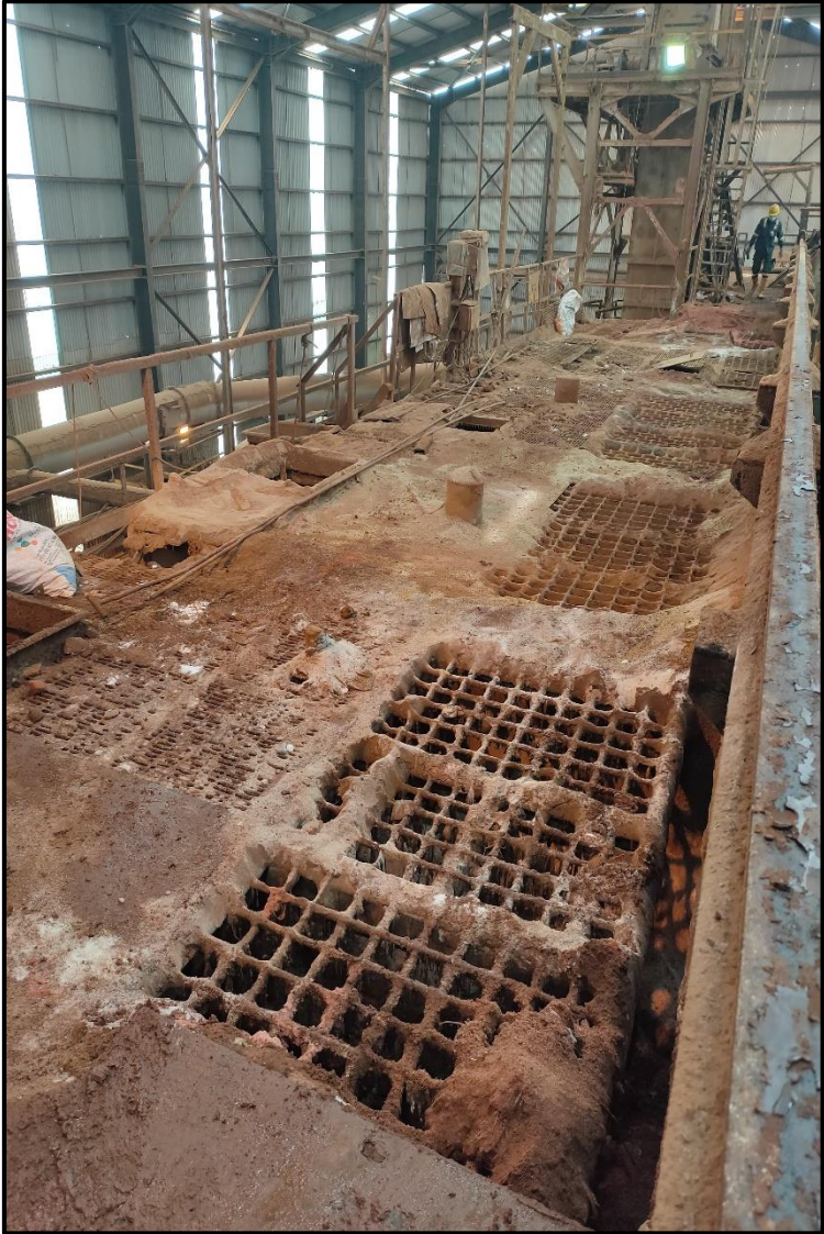
Lampiran 11 Sub Bagian Dozometer (Bin Hopper)