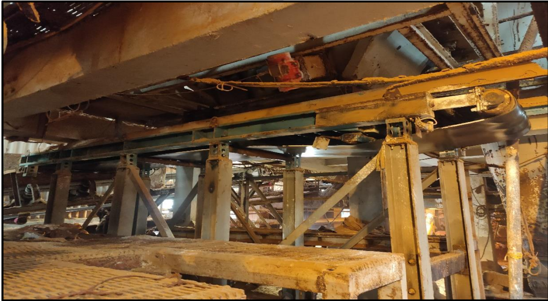
Lampiran 8 Dozometer 18M4101