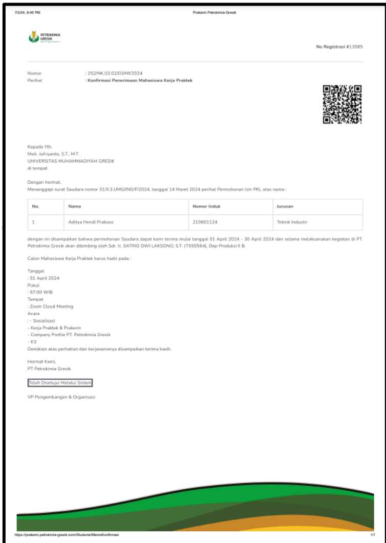
Lampiran 1 Bukti Penerimaan Kerja Praktek