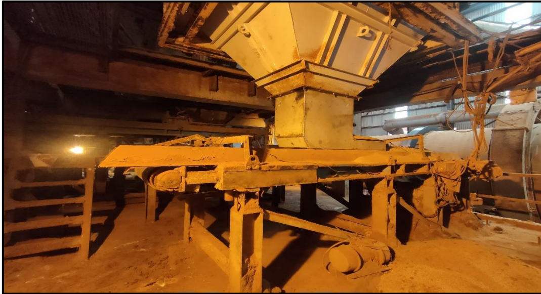
Lampiran 10 Dozometer 18M4103