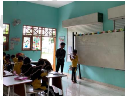
Dokumentasi siklus II