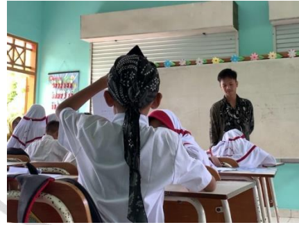
Dokumentasi siklus I