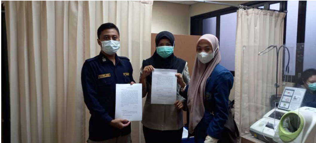
Foto Bersama dengan Pegawai KKP