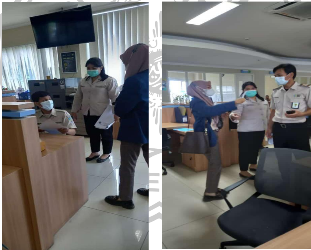
Foto Pembagian Kuesioner kepada Pegawai KKP