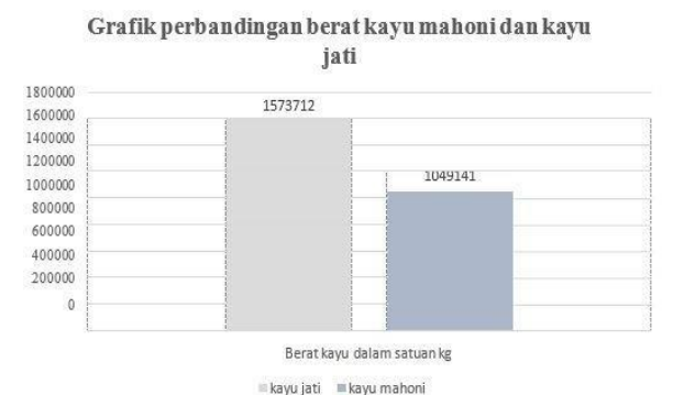
Gambar 6. Perbandingan berat kayu

1. Dari grafik perbandingan harga kayu jati dan kayu mahoni untuk pembuatan kapal kayu, biaya pembuatan kapal kayu lebih terjangkau apabila menggunakan kayu Mahoni dengan harga Rp. 15.737,126 di bandingkan kayu jati dengan harga Rp. 31.474,252