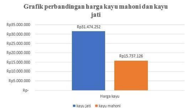
Gambar 5. Perbandingan harga

1. Dari grafik perbandingan harga kayu jati dan kayu mahoni untuk pembuatan kapal kayu, biaya pembuatan kapal kayu lebih terjangkau apabila menggunakan kayu Mahoni dengan harga Rp. 15.737,126 di bandingkan kayu jati dengan harga Rp. 31.474,252