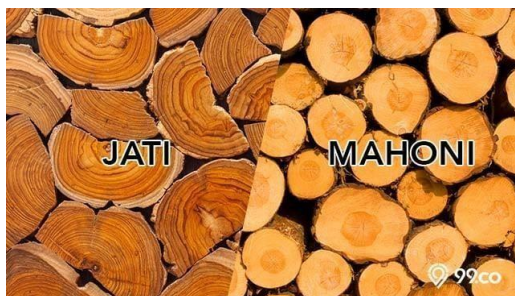
Gambar 1. Kayu mahoni dan kayu jati

Tumbuhan berkayu pertama kali muncul sekitar 395 hingga 400 juta tahun yang lalu. Sejak saat itu, Sejak dulu, manusia telah memanfaatkan kayu untuk berbagai keperluan. Melalui variasi jarak antar lingkaran pertumbuhan, kayu juga dapat memberikan informasi sejarah mengenai iklim dan cuaca pada saat pohon tersebut tumbuh (Paputungan et al., 2022).