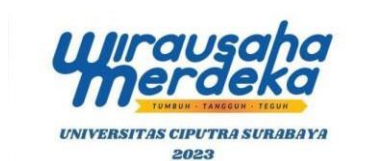
Gambar 2. 1 Logo Program

Kewirausahaan Mandiri adalah program yang diprakarsai oleh Kementerian Pendidikan, Kebudayaan, Penelitian, dan Teknologi Republik Indonesia yang dirancang khusus untuk mahasiswa yang tertarik dalam bidang Kewirausahaan. Ini menawarkan siswa kesempatan untuk terlibat dalam Program Kewirausahaan Unggul dalam Pendidikan Tinggi. Tujuan Wirausaha Merdeka adalah untuk memicu antusiasme dan dedikasi siswa terhadap kewirausahaan, menanamkan pola pikir dan kompetensi dasar dalam domain kewirausahaan,