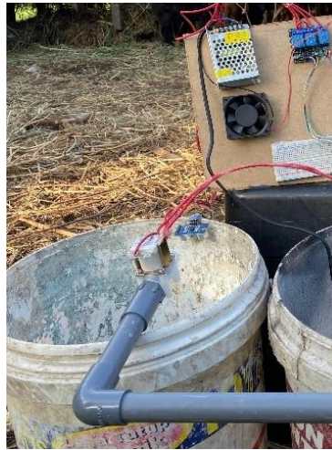
Gambar 3. Prototype

Pada kali ini ialah hasil dan pembahasan dari suatu alat yang telah di buat kemudian di uji dengan semestinya, ada beberapa data hasil pengujian yang dapat di lihat sebagai berikut ini.