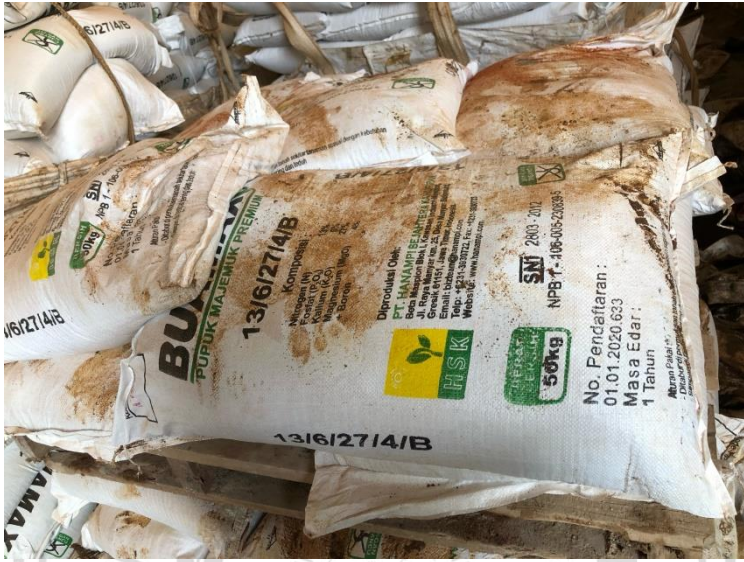
Lampiran 1 Pupuk Buamax 13/6/27/4/B