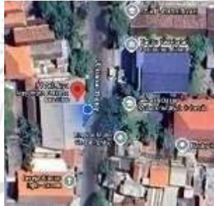
Gambar 2. 2 Lokasi PT AJNP

Nama Perusahaan : PT Adi Jaya Nusantara Perkasa Gresik Alamat : Jl. Harun Thohir No. 38, Pulo Pancikan, Perusahaan Gresik, Jawa Timur.