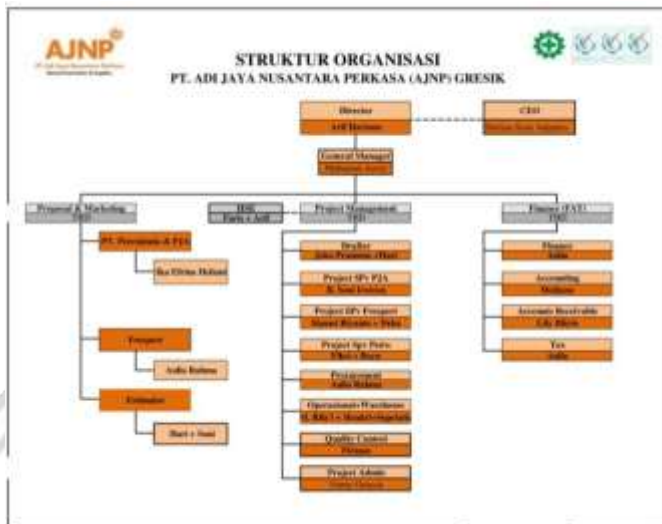
Gambar 2. 3 Struktur Organisasi PT AJNP