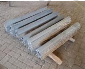
Lampiran 7 Siku – siku Baja