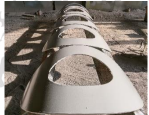
Lampiran 9 Plat yang sudah dilubangi