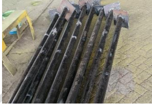
Lampiran 2 Pipa Baja yang sudah di Welding