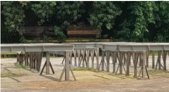
Lampiran 13 Frame