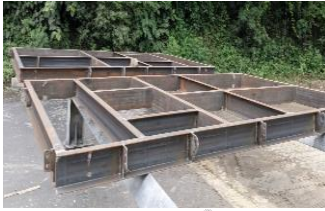
Lampiran 11 Rangka Platform Baja