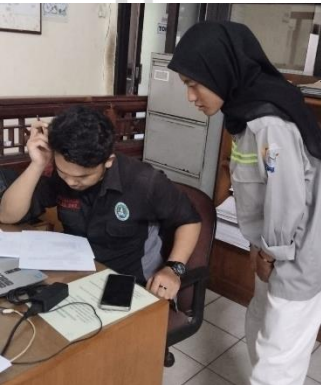
Lampiran 16 Diskusi Progres Proyek