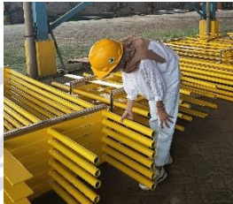
Lampiran 14 Pipa