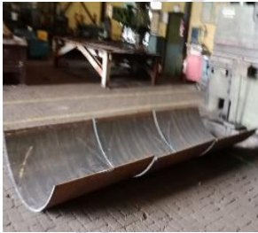
Lampiran 4 Plat Baja yang sudah dibentuk