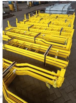
Lampiran 18 Visual Produk B