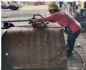
Lampiran 8 Proses cutting Plat Baja