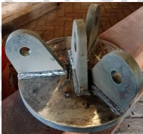
Lampiran 5 Komponen Bracket