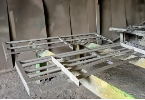
Lampiran 1 Hasil Pengecatan ( Painting )