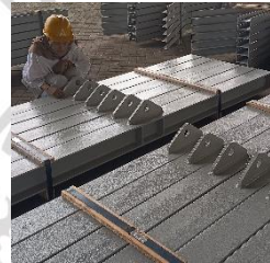
Lampiran 15 Observasi Visual