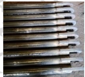
Lampiran 6 Batang Pengait