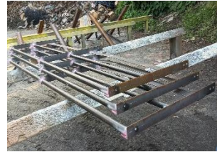
Lampiran 12 Frame Jalur Pipa