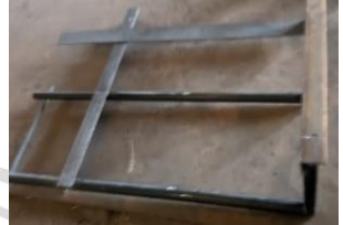
Lampiran 3 Rangka Baja yang sudah di Welding