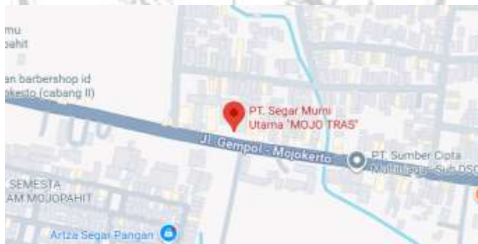
Gambar 2. 2 Lokasi PT Segar Murni Utama

Alamat Perusahaan : Jl. Raya Gayaman, Gayaman, Kec. Mojoanyar, Kabupaten Mojokerto, Jawa Timur 61364