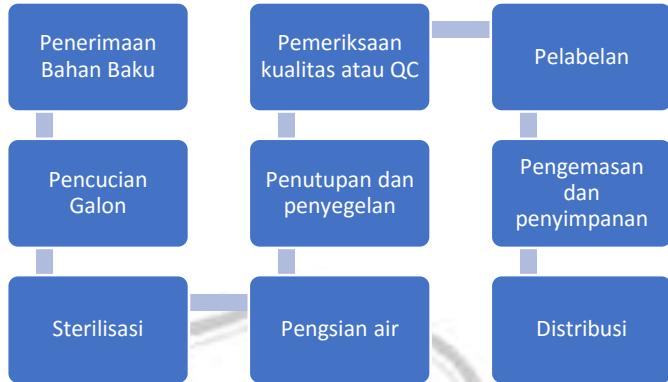
Gambar 2. 4 Alur Proses Produksi