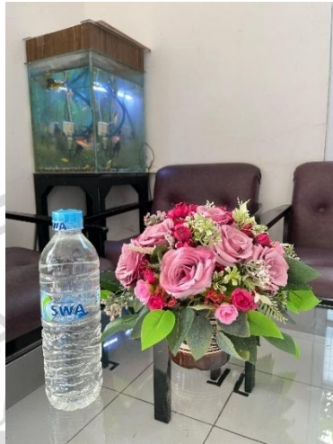
Gambar 2. 5 Botol 600 ML