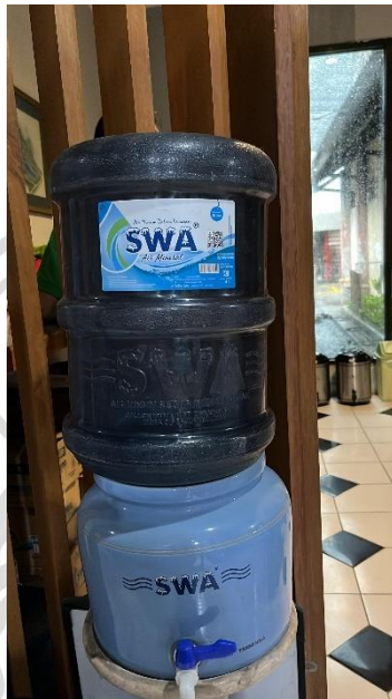
Gambar 2. 7 Galon 19 Liter