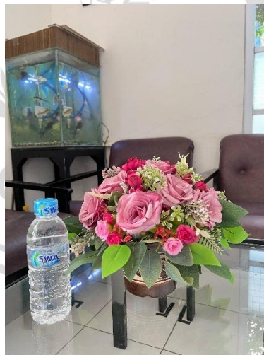
Gambar 2. 4 Botol 330 ML