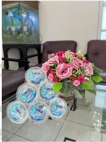
Gambar 2. 3 Gelas SWA 240 ML