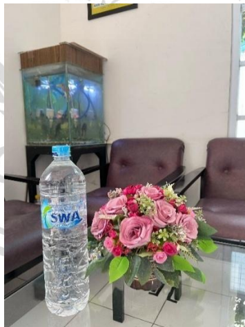
Gambar 2. 6 Botol 1500 ML