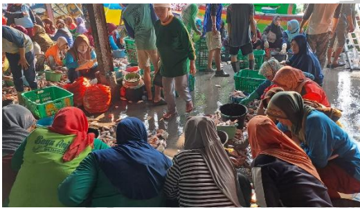
Gambar 4. Proses Sortir Ikan