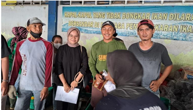
Gambar 7. Proses Wawancara dengan Informan