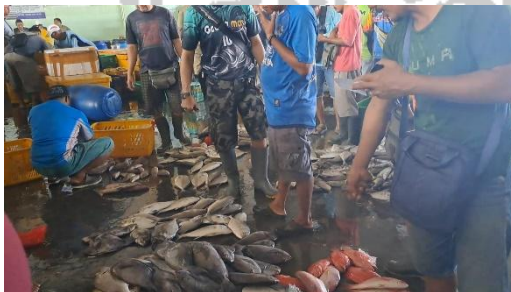
Gambar 5. Proses Pencatatan Hasil Tangkapan