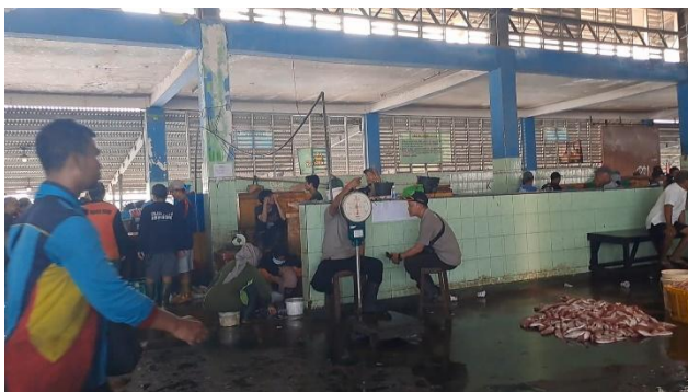
Gambar 6. Proses Penimbangan Ikan