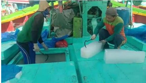
Gambar 3. Proses Persiapan Perbekalan