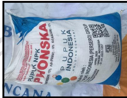
Gambar 2.8 . Pupuk NPK Phonska.

Keterangan: Kandungan pupuk phonska meliputi Nitrogen (N) 15% , Fosfor (P) 15%, Kalium (K) 15%, Sulfur (S) 10%, dan kadar air maksimal 2%.