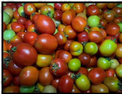
Gambar 2.6 Penanganan Pasca Panen Setelah 92 (HST).

Bunga tanaman tomat terdiri dari benang sari (benang sari) yang mengembang membentuk sarung yang membalut putik. Tangkai benang sari pendek, dan kantong sari memiliki 12 alur, sehingga berbentuk seperti granat (Manalu, 2019). Bunga tomat tersusun dalam rangkaian dengan jumlah kuntum sekitar 30-70 per kluster.