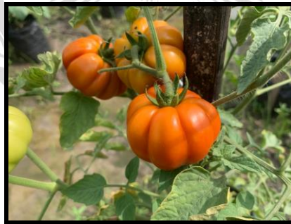
Gambar 2.10 Tomat Gammara F 1 Berumur 69 Hari Setelah Tanam (HST). Keterangan: Menghasilkan buah berwarna merah dengan pembentukan buah medium, kulit dan daging yang tebal, memiliki rasa manis.

Tomat Gammara F 1 adalah varietas hibrida yang dikembangkan melalui persilangan dua varietas murni untuk menghasilkan tanaman dengan sifat unggul. Varietas ini dikenal karena hasil panen yang tinggi, ketahanan terhadap penyakit, dan kualitas buah yang baik (Kumar, 2020). Buahnya berukuran sedang hingga besar, berwarna merah cerah, memiliki tekstur padat, dan rasa manis (Ali, 2021), serta menunjukkan ketahanan yang baik terhadap penyakit (Sihombing, 2022).