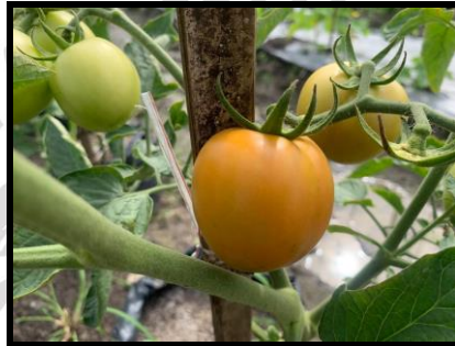
Gambar 2.9 Tomat Servo F 1 Berumur 69 Hari Setelah Tanam (HST).

Keterangan: Pertumbuhan yang menghasilkan buah berwarna merah mengkilap dengan pembentukan buah medium hingga besar, kulit dan daging yang tebal, memiliki rasa buah asam manis dominan asam.