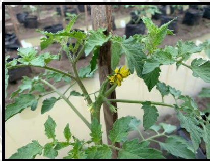
Gambar 2.4 Daun Tomat Berumur 36 Hari Setelah Tanam (HST).

Tanaman tomat memiliki bentuk batang perdu dan dapat mencapai tinggi sekitar 2-3 meter. Batang tomat mudah patah ketika masih muda, tetapi seiring bertambahnya usia, batangnya menjadi keras dan hampir berkayu, serta berbentuk persegi dengan permukaan berbulu halus. Tomat memiliki batang lembut, cukup kuat, bulu halus dengan kelenjar rambut di antara bulu-bulu tersebut dan banyak cabang jika tidak dipangkas.