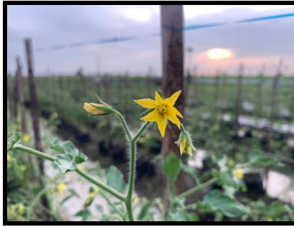
Gambar 2.5 Bunga Tomat Berumur 52 Hari Setelah Tanam (HST).

Keterangan: Pada gambar sangat jelas bahwa tanaman telah memasuki fase berbunga, bunga mekar menunjukkan mulai akan berbuah.