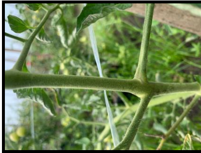
Gambar 2.3 Batang Tomat Indeterminate Pada 59 (HST).

Keterangan: Batang tomat dengan arah tumbuh vertikal dan akan lemah bila tidak ditopang.