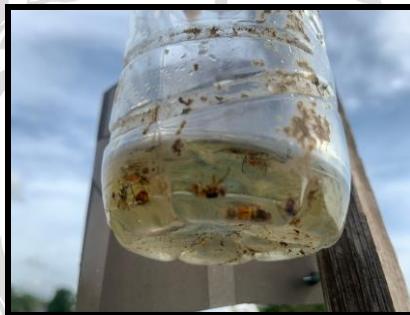
Gambar 2.13 Perangkap Lalat Buah ( Bactrocera sp. ).

Keterangan: Pengendalian dilakukan menggunakan perangkap dan larutan bahan kimiawi yang memiliki kandungan metil eugenol yang berfungsi menarik dan membunuh lalat. Larutan berwarna kuning jernih yang digunakan sebagai perangkap lalat buah jantan.