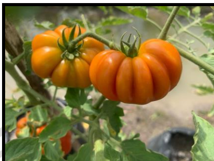
Gambar 2.1 Tomat Gammara F 1 Berumur 69 Hari Setelah Tanam (HST). Keterangan: Tanaman tomat menunjukkan pertumbuhan sehat dengan pembentukan buah berkembang.

Menurut (Jaratenghar, 2020) tanaman tomat adalah keluarga dari Solanaceae yang secara lengkap memiliki klasifikasi sebagai berikut :