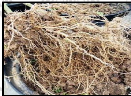
Gambar 2.2 Akar Tomat Setelah Panen 116 Hari Setelah Tanam (HST).

Keterangan: Tampak akar menunjukkan kondisi tanah mendukung pertumbuhan optimum.