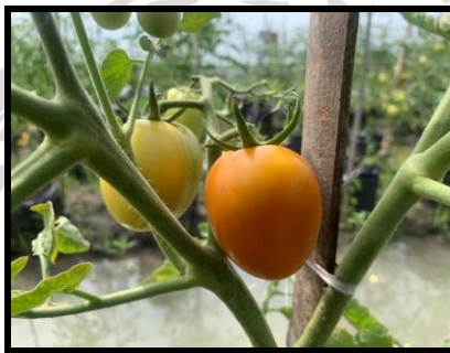
Gambar 2.11 Tomat Tymoti F 1 Berumur 69 Hari Setelah Tanam (HST).

Keterangan: Menghasilkan buah berwarna oranye dengan pembentukan buah besar, kulit dan daging yang tebal, memiliki rasa manis.