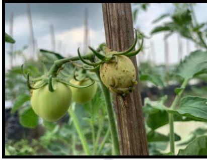
Gambar 2.14 Pengendalian Ulat Buah.

Keterangan: Penyemprotan larutan bahan kimiawi yang memiliki kandungan klorantraniliprol yang efektif membasmi ulat buah.