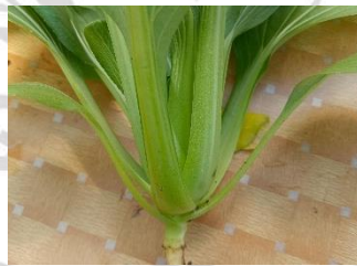
Gambar 2.2. Batang Tanaman Pakcoy

Tanaman pakcoy termasuk dalam tanaman dengan batang yang relatif pendek dengan ruas-ruas yang rapat, sehingga tampak seolah-olah tidak terlihat secara jelas. Tanaman ini mempunyai batang utama yang tertutupi pelepah daun, dan termasuk dalam jenis batang basah dan batang semu. Tanaman dengan batang dominan basah mempunyai ciri batang lunak, mudah dipotong dan mengandung air. Tanaman pakcoy juga dikategorikan sebagai tanaman berbatang semu yang terbentuk akibat pelepah daun yang tumbuh rapat, saling melekat dengan yang lainnya, dan tersusun secara teratur. Batang tanaman pakcoy berperan penting sebagai penghubung antara sistem perakaran dan bunga, mempermudah proses identifikasi morfologi tanaman, serta membantu menopang dan menjaga posisi daun agar tetap tegak. Batangnya berwarna hijau dan juga berfungsi sebagai struktur pendukung serta tempat melekatnya daun (Setiawan, 2022). Lebih jelasnya gambar batang pakcoy pada Gambar 2.2. sebagai berikut..