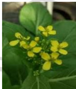
Gambar 2.4. Bunga Tanaman Pakcoy

Tanaman pakcoy memiliki struktur bunga dengan banyak percabangan, berwarna kuning, dan bunga pada tanaman pakcoy terhadap buah dengan bentuk seperti buah polong dan berongga-rongga serta memiliki warna kecoklatan. Tanaman ini mempunyai susunan bunga yang cukup tertata dengan tangkai bunga yang berukuran cukup panjang serta mempunyai empat kelopak bunga, empat benang sari, satu putik, dan empat mahkota kuning (Pranata, 2018). Proses penyerbukan pada bunga dapat terjadi melalui bantuan agen penyerbuk seperti serangga (entomofili) maupun melalui intervensi manusia secara manual (Barokah et al. , 2017). Lebih jelasnya gambar bunga pakcoy pada Gambar 2.4. sebagai berikut.