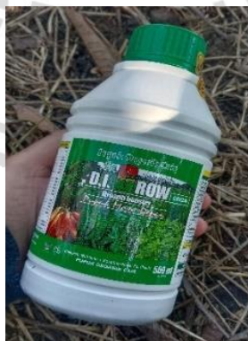
Gambar 2.5. POC D.I. Grow

POC D.I. Grow juga meningkatkan ketahanan tanaman terhadap hama dan penyakit, karena mengandung senyawa antimikroba alami. Selain itu, pupuk ini memperbaiki struktur tanah dengan meningkatkan aktivitas mikroorganisme serta memperbaiki porositas tanah agar akar lebih mudah menyerap nutrisi dan air. Pupuk ini cepat diserap tanaman karena mudah larut dalam air, dan dapat diaplikasikan melalui penyemprotan daun atau dikocorkan ke tanah. Sangat cocok untuk berbagai jenis tanaman, misalnya hortikultura, tanaman pangan dan perkebunan. Keunggulan lain adalah sifatnya yang ramah lingkungan karena berbahan dasar organik, aman bagi tanah, tanaman, dan manusia, serta tidak meninggalkan residu kimia berbahaya. POC D.I. Grow menjadi pilihan unggul karena efektivitasnya dalam meningkatkan hasil pertanian secara alami dan berkelanjutan. Gambar POC D.I. Grow disajikan pada Gambar 2.5. sebagai berikut.