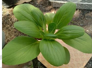
Gambar 2.3. Daun Tanaman Pakcoy

tanaman pakcoy mempunyai daun dengan permukaan yang sangat halus dan tidak berbulu. Tangkai daun pakcoy yang lebar, berdaging, dan berwarna hijau muda menjadikannya jelas berbeda dari varietas sayuran lainnya. Lebih jelasnya gambar daun pakcoy pada Gambar 2.3. sebagai berikut..