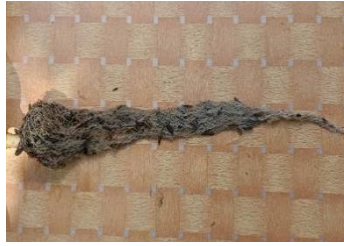
Gambar 2.1. Akar Tanaman Pakcoy