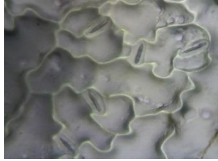
Gambar 2.6. Bentuk Stomata Tanaman Pakcoy