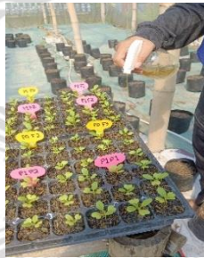
Gambar 3.7. Pengaplikasian POC D.I. Grow

Pemeliharaan tanaman pakcoy dalam polybag memerlukan penyiraman dan pemupukan. Penyiraman dilakukan setiap hari, pagi dan sore, untuk menjaga kelembapan media tanam. Pupuk organik cair D.I. Grow digunakan untuk pemupukan tambahan (perawatan) dengan interval tujuh hari, dengan cara pemberian pupuk pada daun. Perawatan tanaman Pakcoy ditunjukkan pada Gambar 3.7. sebagai berikut.