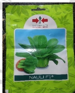
Gambar 3.3. Benih Pakcoy Varietas Nauli F1

Pemilihan benih merupakan langkah awal yang sangat penting dalam proses penelitian. Benih yang digunakan haruslah varietas unggul, memiliki tingkat perkecambahan yang tinggi, dan tahan terhadap hama dan penyakit. Benih varietas Nauli F1 dari pakcoy digunakan dalam penelitian ini. Benih varietas Nauli F1 dari pakcoy disajikan pada Gambar 3.3. sebagai berikut.