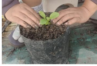
Gambar 3.6. Pindah Tanam Pakcoy