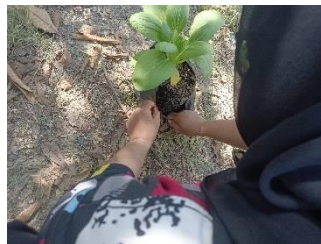
Gambar 3.8. Pemanenan Pakcoy

Tanaman pakcoy siap untuk dipanen dalam waktu 35 HSS. Pemanenan dapat dilakukan dengan mencabut seluruh tanaman, termasuk akarnya. Setelah dipanen, tanaman dicuci dengan air bersih untuk menghilangkan kotoran dan sisa tanah, kemudian ditimbang. Pemanenan tanaman pakcoy disajikan pada Gambar 3.8 sebagai berikut.