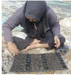
Gambar 3.4. Penyemaian Benih Pakcoy

guna memelihara kelembapan tanah. Penyemaian benih disajikan pada Gambar 3.4. sebagai berikut.