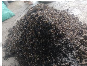
Gambar 3.5. Persiapan Bahan Media Tanam

Persiapan bahan tanam meliputi media tanam dan polybag. Media tanam yang digunakan terdiri dari tanah grumusol dan sekam padi bakar dengan perbandingan 2:1, seberat 1,5 kg. Polybag yang digunakan berukuran 25 x 25 cm. Sebelum digunakan untuk penanaman, media tanam dalam polybag perlu disiram terlebih dahulu, untuk memastikan kondisi tanah tetap lembap. Persiapan bahan tanam disajikan pada Gambar 3.5 sebagai berikut.