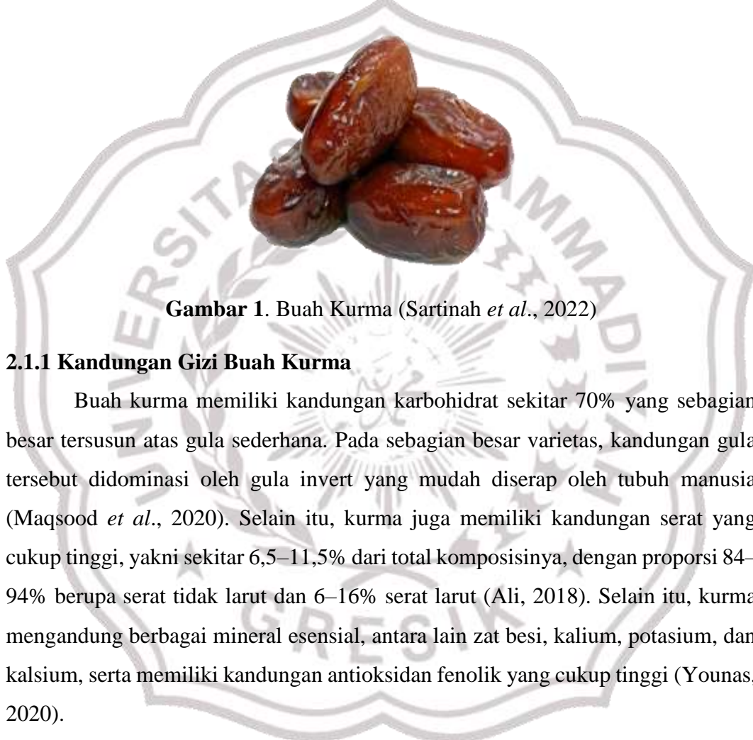
Gambar 1. Buah Kurma (Sartinah et al. , 2022)

kurma serta teknik penanganan pascapanen yang diterapkan (Al-Farsi, 2008). Penelitian Matloob dan Balakita (2016) terhadap beberapa varietas kurma menunjukkan bahwa kadar fenolik total pada buah ini relatif lebih tinggi dibandingkan dengan berbagai jenis buah lain, seperti pisang, anggur merah, apel, nanas, delima, pepaya, jeruk, blueberry, dan aprikot. Kandungan senyawa fenolik yang tinggi tersebut mengindikasikan bahwa kurma memiliki potensi sebagai bahan pangan dengan nilai nutrasetikal yang baik (Gondokesumo & Susilowati, 2021).