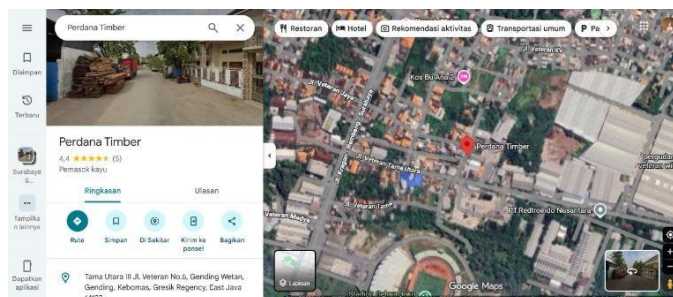
Gambar 1.3 Peta Lokasi CV. Perdana Timber.

Lokasi perusahaan/instansi tempat mahasiswa melaksanakan kegiatan magang berada di Tama Utara III No. 6, Jalan Veteran, Desa Gending Wetan, Kecamatan Gending, Kabupaten Gresik, Provinsi Jawa Timur, dengan kode pos 61123. Lokasi tersebut tergolong strategis karena berada di kawasan yang mudah diakses melalui jalur utama Jalan Veteran, yang merupakan salah satu jalan penghubung penting di wilayah Gresik.