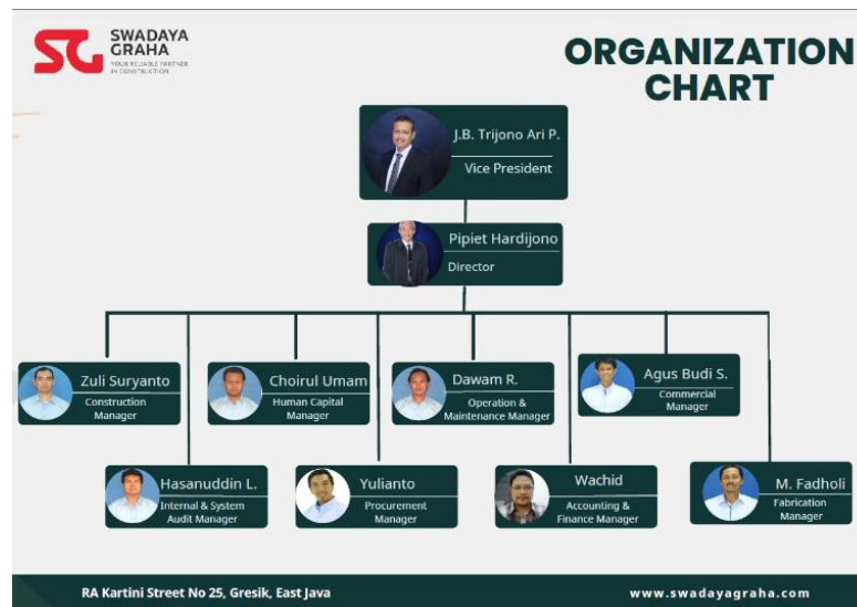
Gambar 1.5 Struktur Organisasi PT Swadaya Graha