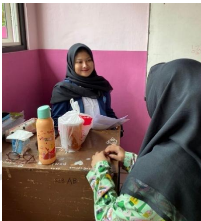
Dokumentasi Subjek 1