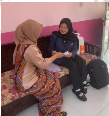
Dokumentasi Subjek 2