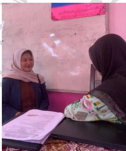
Dokumentasi Subjek 3