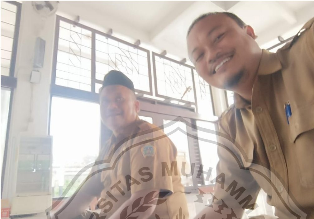
Interview dengan JAM yang berlokasi di Masjid Inabah Pemkab. Gresik