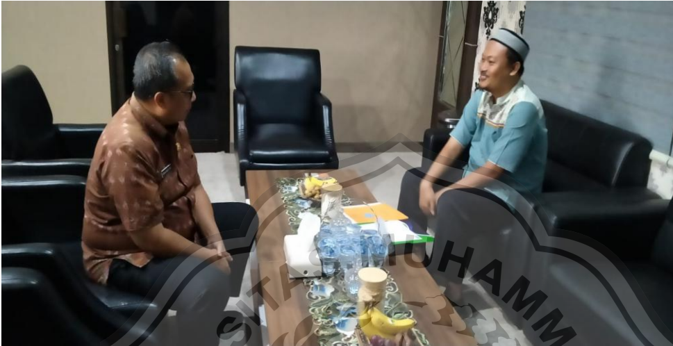
Interview dengan SEK yang berlokasi di Lt.2 Kantor Pemkab. Gresik