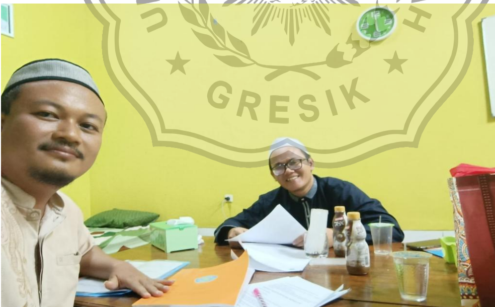
Interview dengan KTM yang berlokasi di Masjid Inabah Pemkab. Gresik