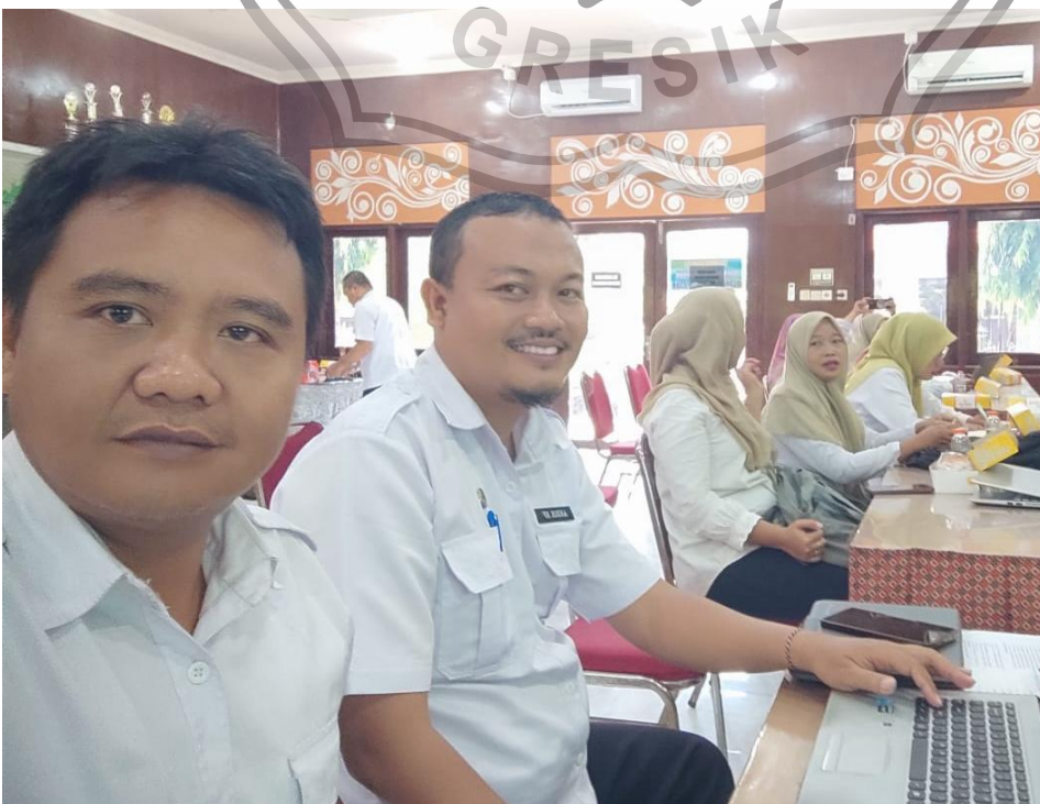
Interview dengan JBM yang berlokasi di Kantor Pemkab.Gresik