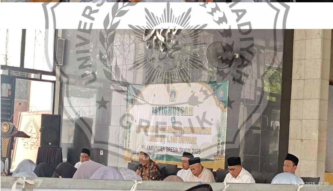
Suasana Istighosah tiap bulan sekali di masjid Inabah