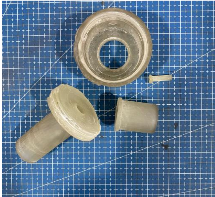
Gambar lampiran 1. 3 hasil cetak nozzle venturi sistem buka tutup