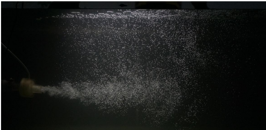
Gambar lampiran 1. 6 foto sebaran microbubble .