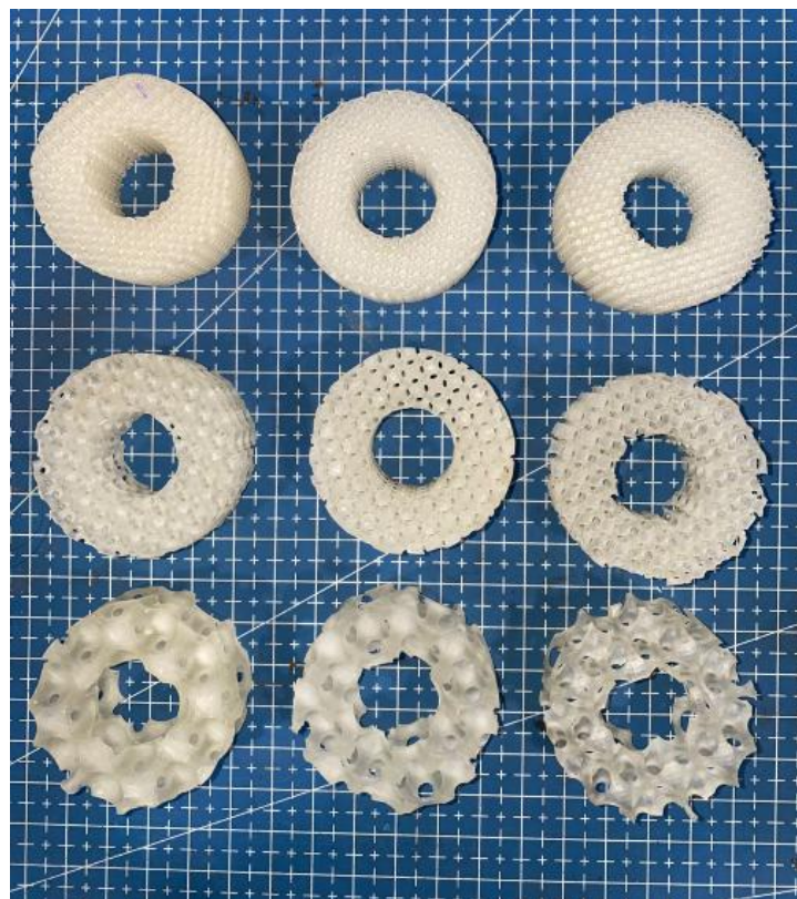
Gambar lampiran 1. 4 hasil cetak membran foam .