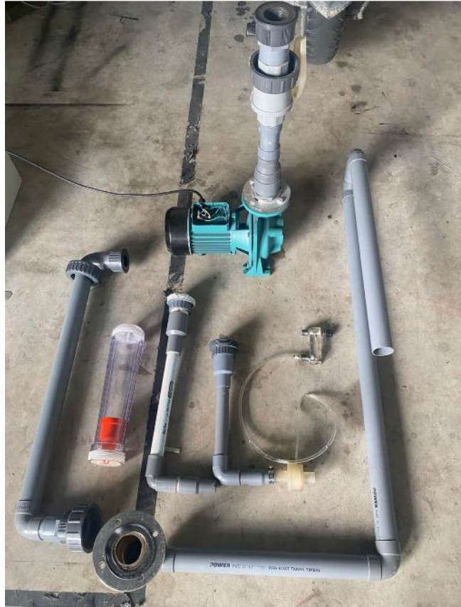
Gambar lampiran 1. 5 alat untuk dirakit di microbubble generator .