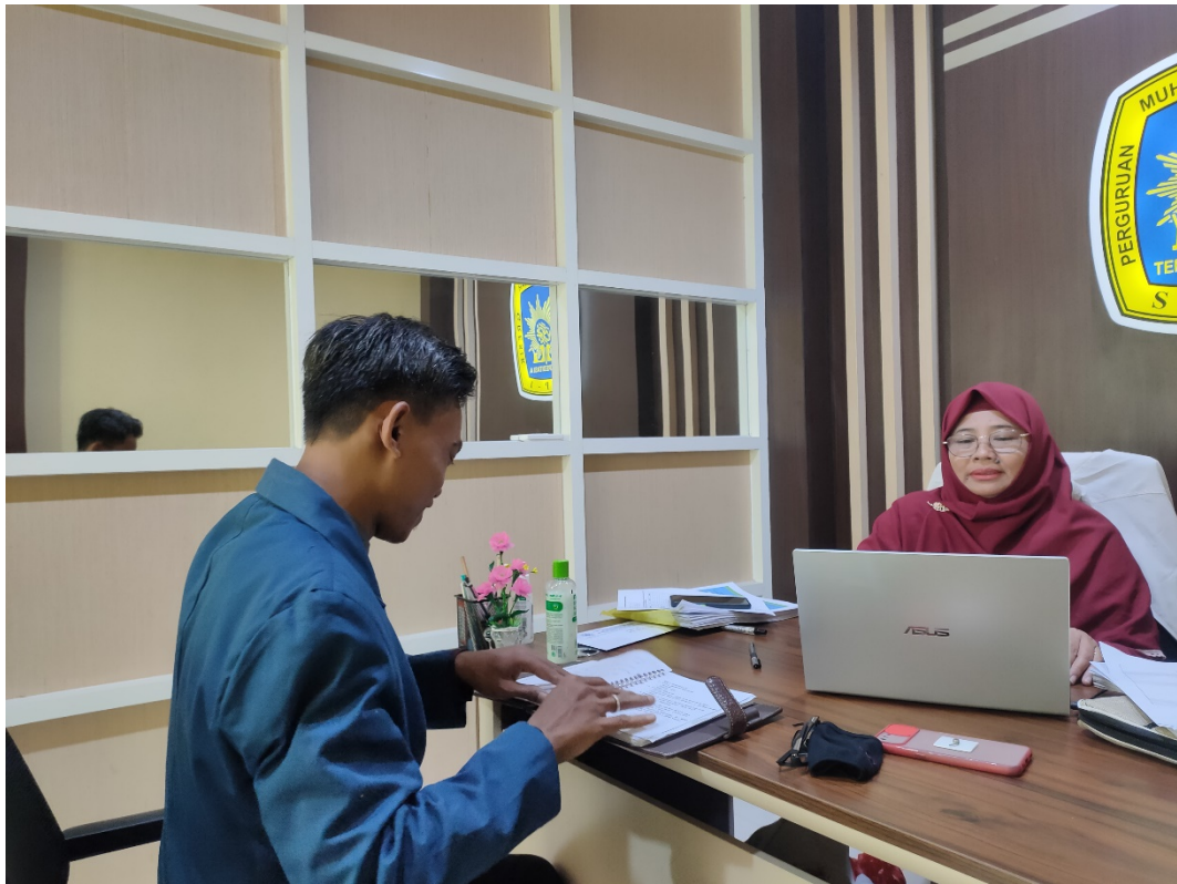
Gambar 7 Wawancara dengan Kepala Sekolah