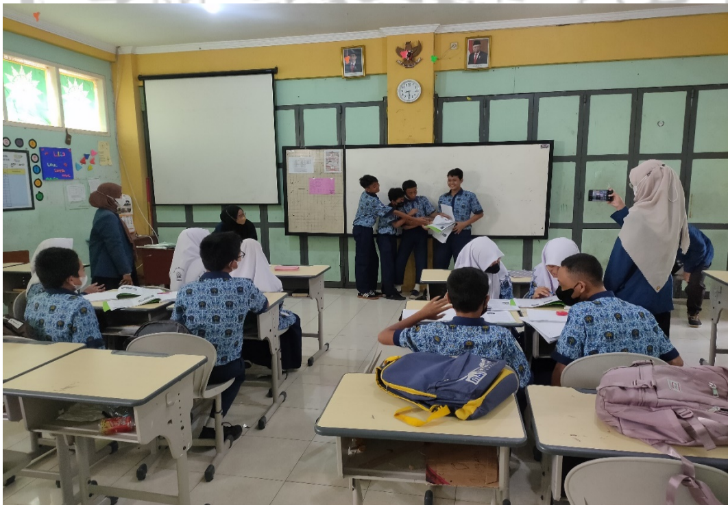
Gambar 6 Proses Pembelajaran Bahasa Arab