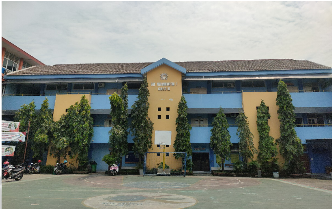
Gambar 1 Gedung Sekolah SMP Muhammadiyah 1 Gresik