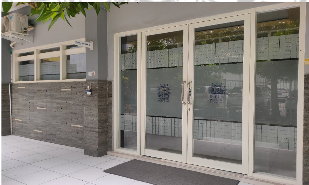
Gambar 2 Ruang Kepala Sekolah