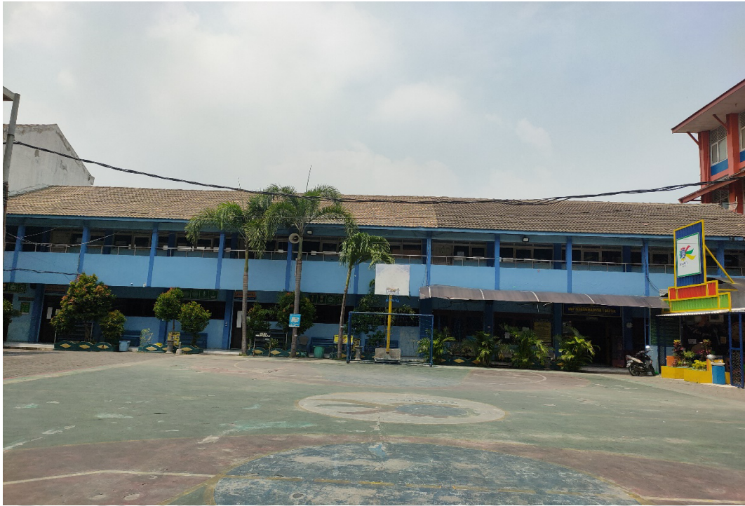
Gambar 5 Lapangan Olahraga