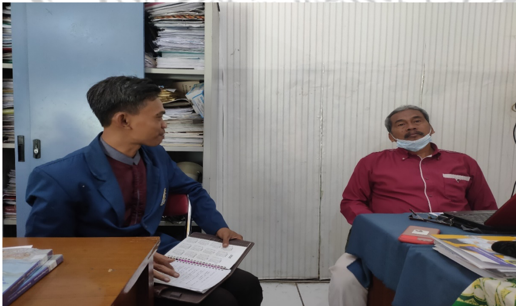
Gambar 8 Wawancara dengan Guru Bahasa Arab