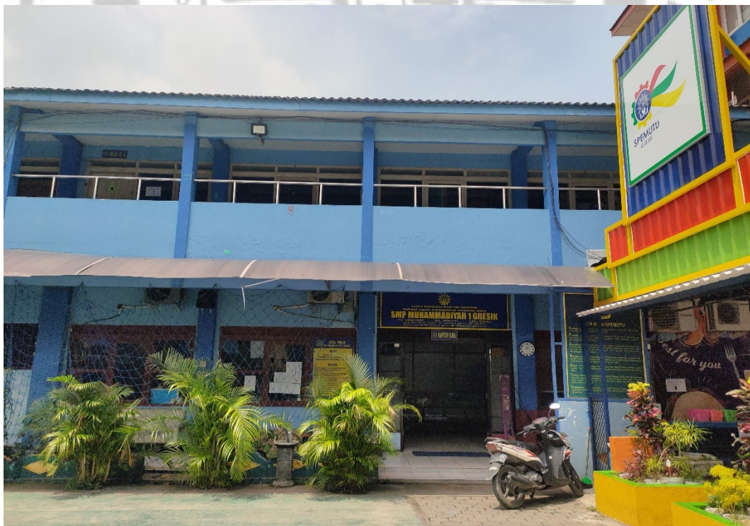
Gambar 4 Ruang Guru