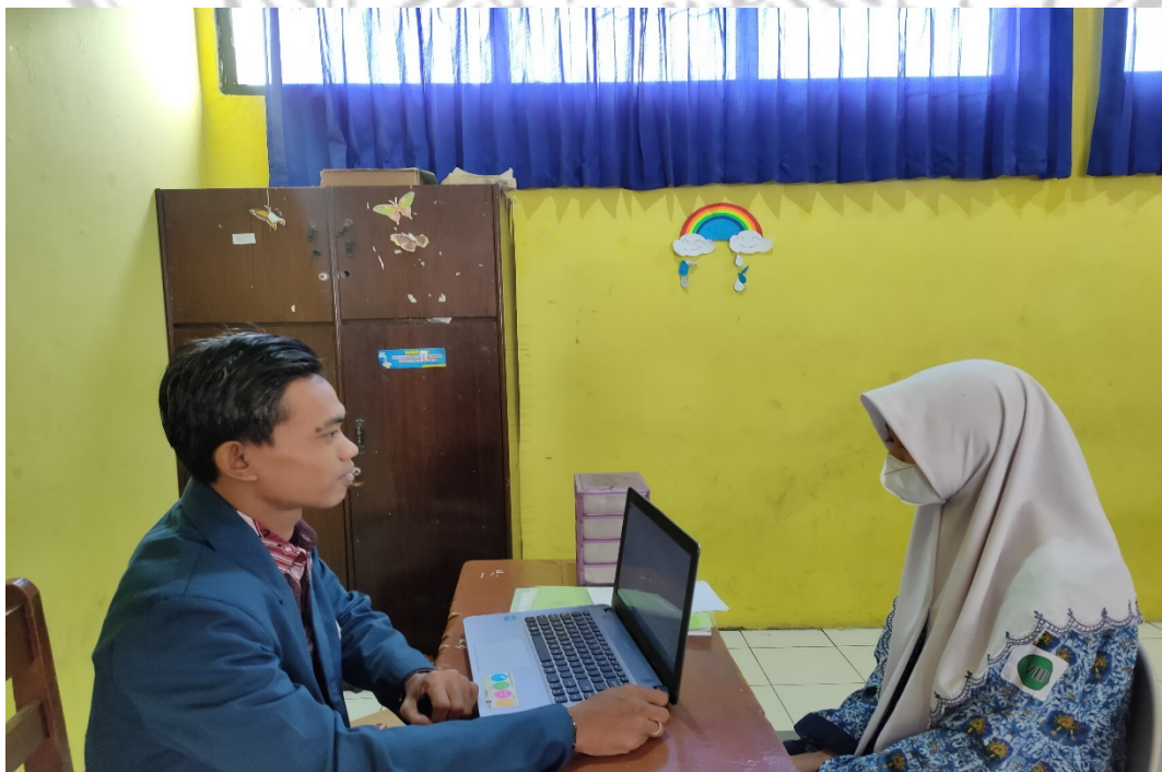
Gambar 10 Wawancara dengan Siswi