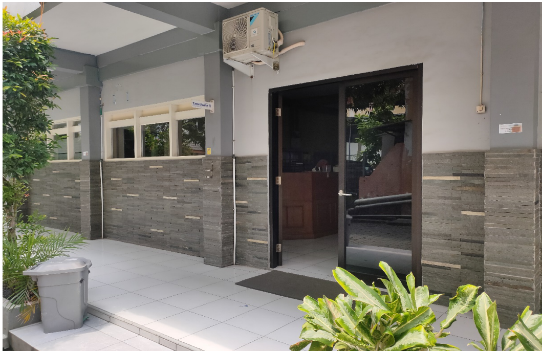
Gambar 3 Ruang Tata Usaha