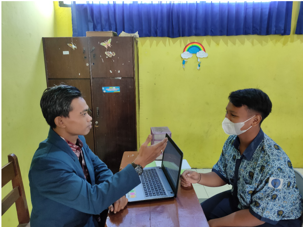
Gambar 9 Wawancara dengan Siswa