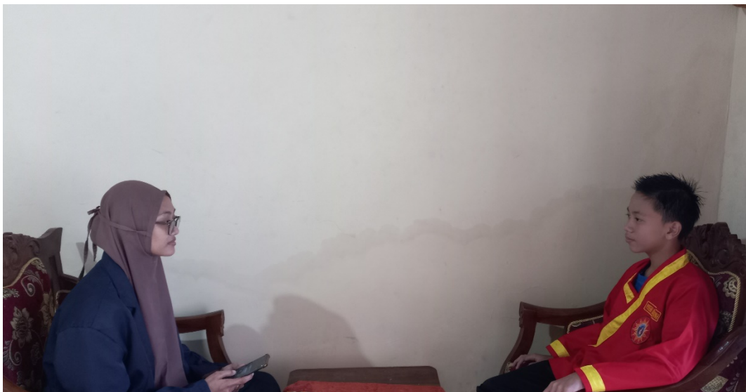
Gamba 2 Wawancara dengan Siswa Tapak Suci