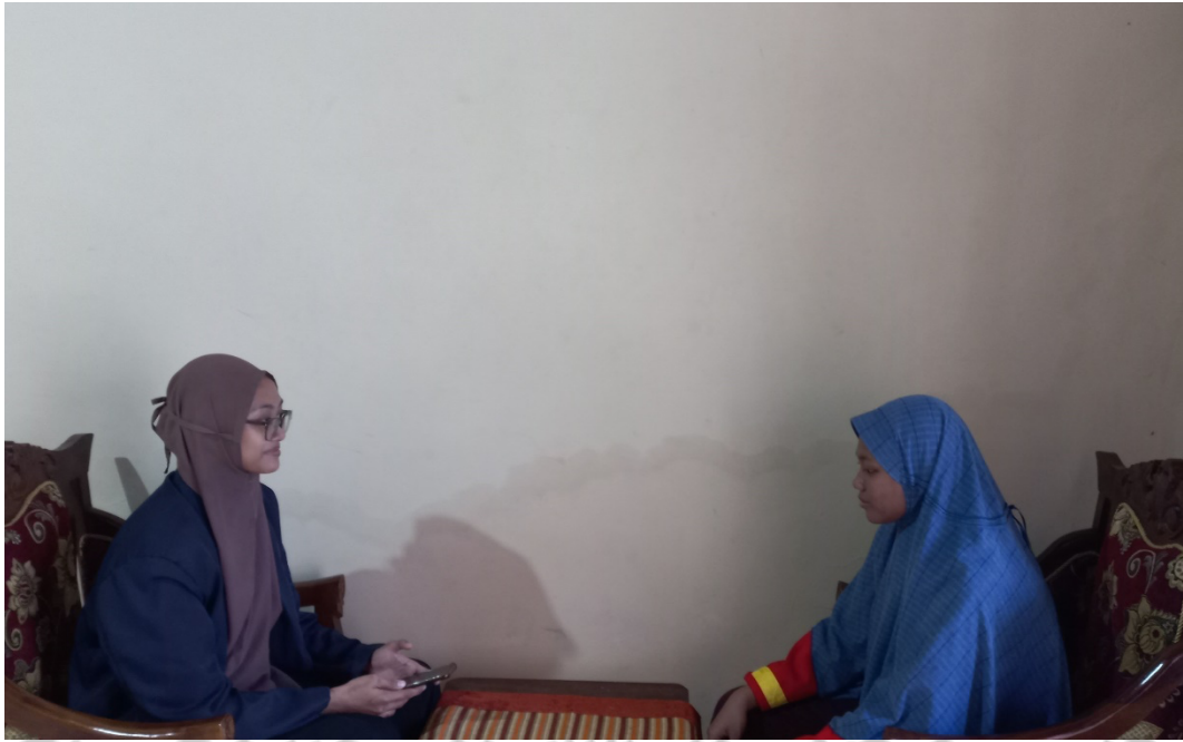
Gambar 3 Wawancara dengan Siswi Tapak Suci