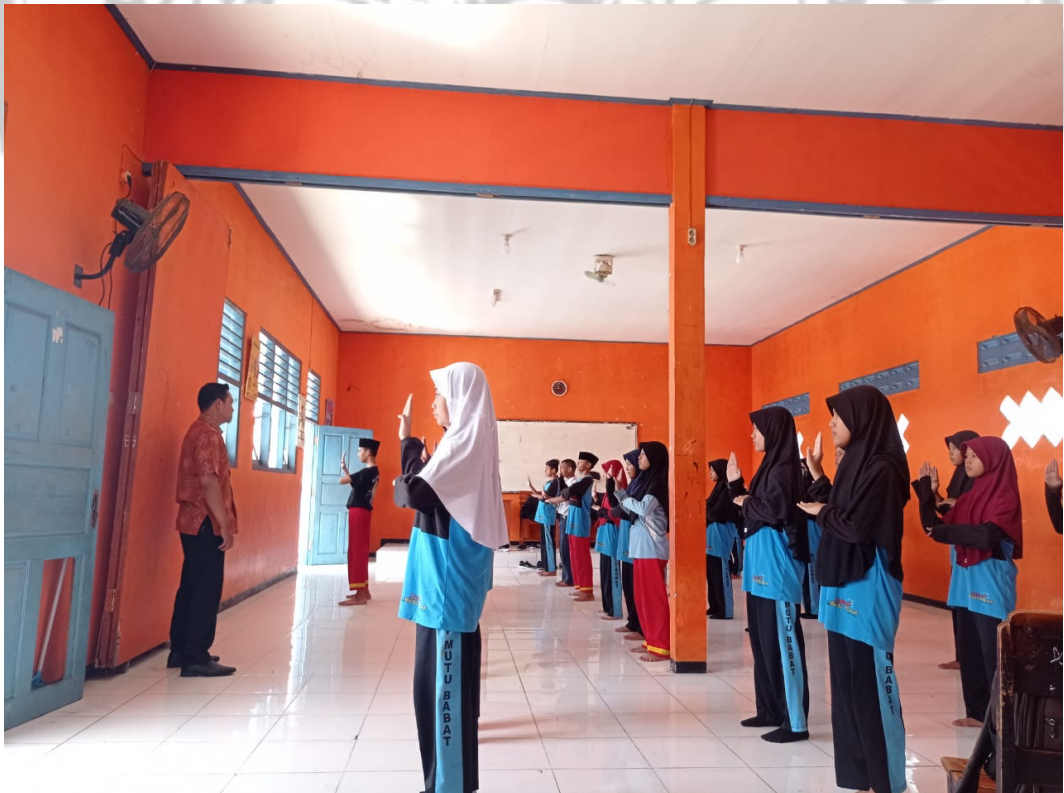
Gambar 6 Latihan di dalam Gedung