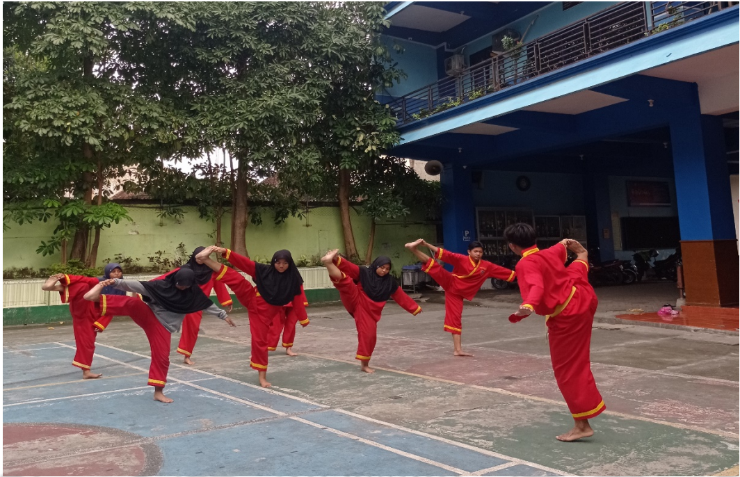
Gambar 5 Pemanasan atau Latihan di Luar