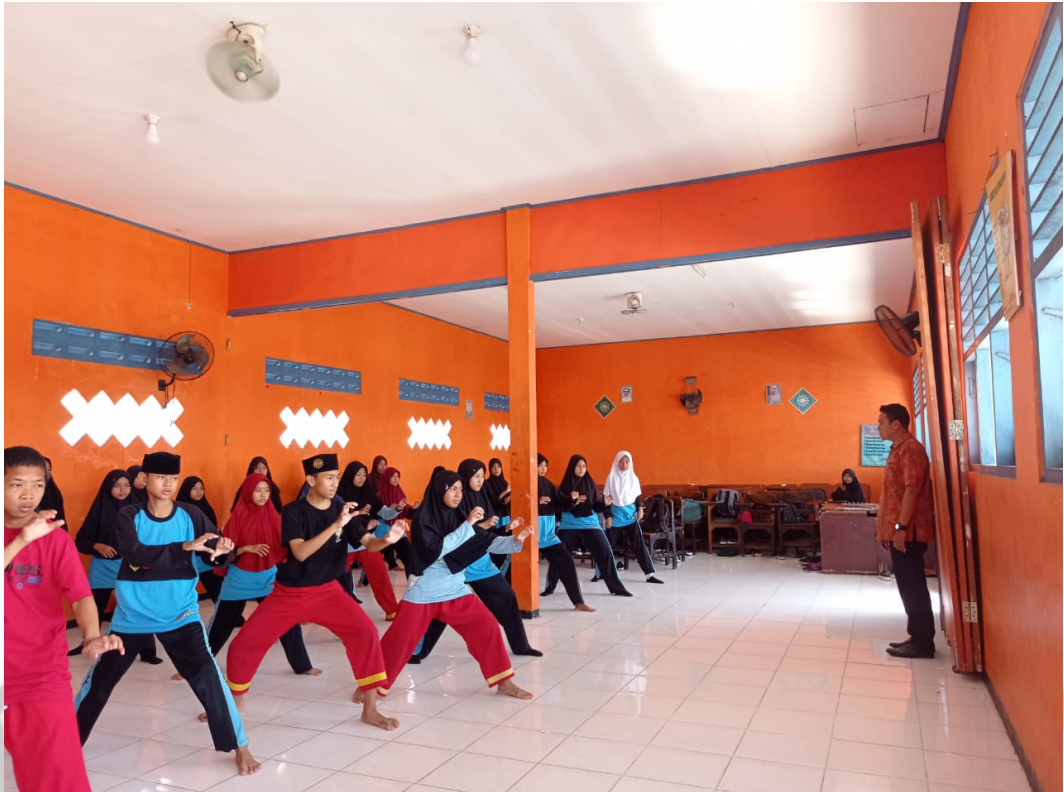
Gambar 7 Latihan di Aula atau di dalam Gedung