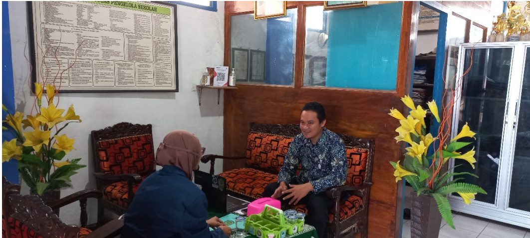
Gambar 1 Wawancara dengan Pelatih sekaligus Kepala Sekolah