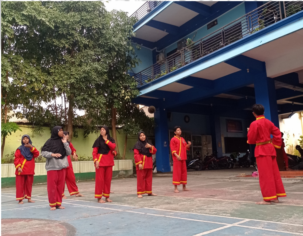
Gambar 4 Latihan di Luar