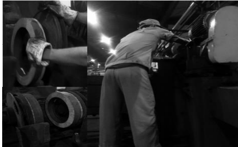
Gambar 1.2 Set up Pergantian Batu Gerinda

Dari gambar 1.2 dianalisa dengan metode ovako working posture analysis system .