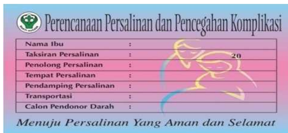
Gambar 2.1 Stiker P4K