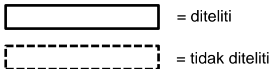
Gambar 3.1 Kerangka Konsep Penelitian Hubungan Tingkat Pengetahuan dengan Pemberian ASI Eksklusif (Green dalam Sitorus, 2016).