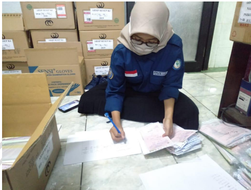
A. Foto ketika mengamati resep