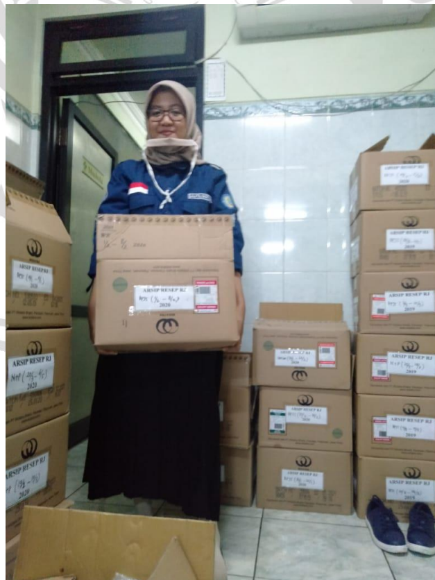
B. Foto ketika memisahkan kardus arsip resep bulan Februari