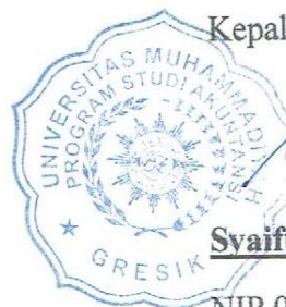
Syaiful, SE, MM