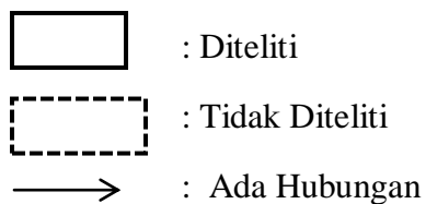
Gambar 3.1 Kerangka Konseptual Pengaruh Pemberian Teknik Mencuci Tangan Pada Anak Prasekolah Di TK Al-Amin Wage Taman Sidoarjo