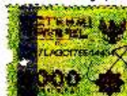
EKA RAHMAWATI NIM 12011005