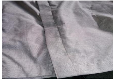
Jenis Cacat Bagian Badan Tidak