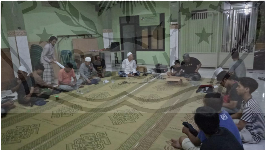
Lampiran 1.4 Rapat Panitia Haul nyai Ageng Putri Ayu Kukusan