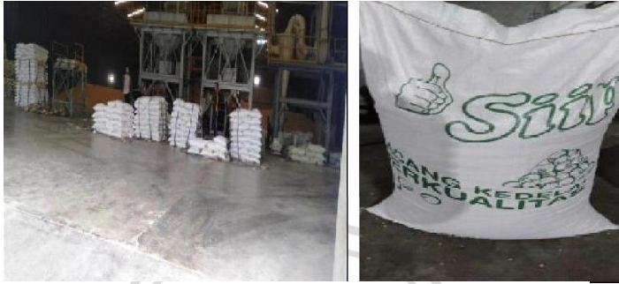
Gambar 2.2 Proses Pengemasan Dan Produk

Kedelai yang sudah di bongkar dalam bentuk curah di dalam container ,kemudian di angkut oleh loader (alat berat) di letakkan pada wadah penampungan.Jika banyak permintaan,maka di lakukan proses bagging/pengemasan secara banyak dengan mesin pengemasan otomatis sebagai stock di waktu mendatang.