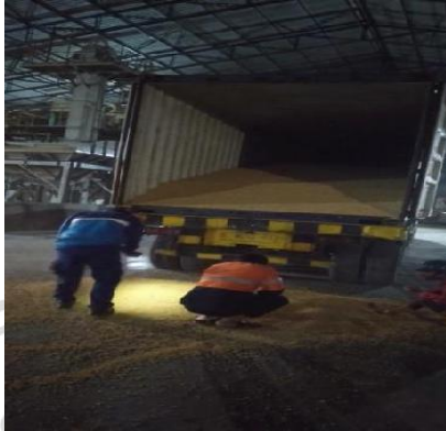
Gambar 2.1 Proses Bongkar

Perencanaan mendatangkan impor kedelai bila stok di gudang menipis. Tugas kepala gudang yang melaporkan kepada atasan (Manager). Impor kedelai dalam penelitian ini yaitu kedelai yang didatangkan dari luar negeri (dalam bentuk curah di dalam container) untuk memenuhi kebutuhan pangan di Indonesia, terutama pada usaha tahu, tempe dan susu kedelai. Impor kedelai dilakukan untuk mengendalikan/membantu usaha maupun kebutuhan masyarakat, bila kedelai lokal gagal masa panen.