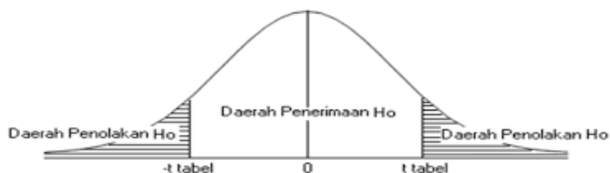
Gambar 3.1 Kurva Daerah Penerimaan dan Penolakan H_0 Uji t