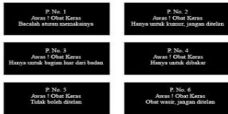
Tabel 3.2 contoh obat bebas terbatas di Apotek :