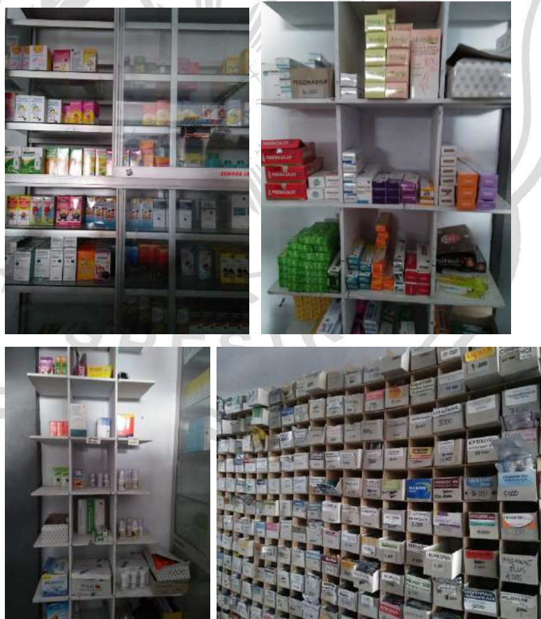
Gambar. 3.3 Penyimpanan Obat