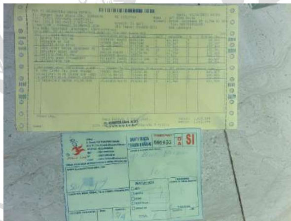
Gambar. 3.2 Faktur dan Tanda Terima Barang

Cara melakukan retur pembelian obat yaitu, ketika barang datang disesuaikan dengan faktur, apabila terdapat barang yang tidak sesuai dengan faktur maka barang tersebut harus disendirikan bersama dengan faktur barang datangnya. Kemudian dilakukan konfirmasi melalui pesan singkat kepada PBF terkait, dengan jarak beberapa hari PBF akan kembali untuk menukar barang yang tidak sesuai dengan barang baru ataupun bisa dilakukan penarikan barang dengan mengurangi jumlah tagihan yang terdapat pada faktur. Pihak PBF akan memberikan faktur baru beserta tanda terima retur barang yang ditanda tangani oleh pihak PBF dan pihak Apotek. Kemudian berita acara diberikan kepada pihak apotek sebagai bukti sah adanya retur barang datang.