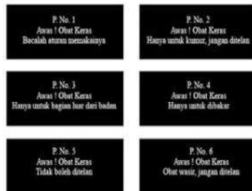
Tabel 3.2 Obat Bebas Terbatas

Obat bebas terbatas merupakan obat yang dalam penggunaannya sesuai dengan aturan pakai, pada umumnya obat bebas terbatas dikonsumsi pada saat memiliki penyakit yang dapat disembuhkan dengan swamedikasi atau pengobatan sendiri. Tanda pada obat bebas terbatas yaitu terdapat lingkaran berwarna biru dengan tepi lingkaran berwarna hitam. Terdapat pula tanda peringatan yang tertera pada kemasannya, yaitu :