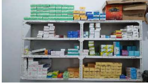
Gambar. 3.4 Gudang