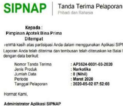
Gambar. 3.6 Pelaporan SIPNAP