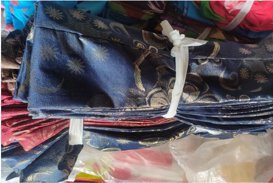
Kondisi kain setelah dipotong