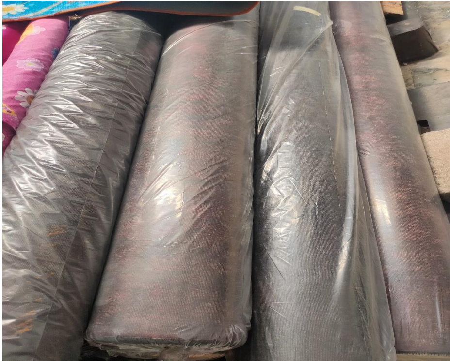
Pengadaan bahan baku kain