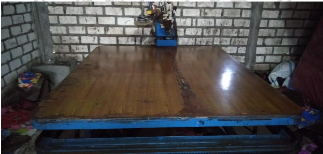
Mesin Jahit Otomatis