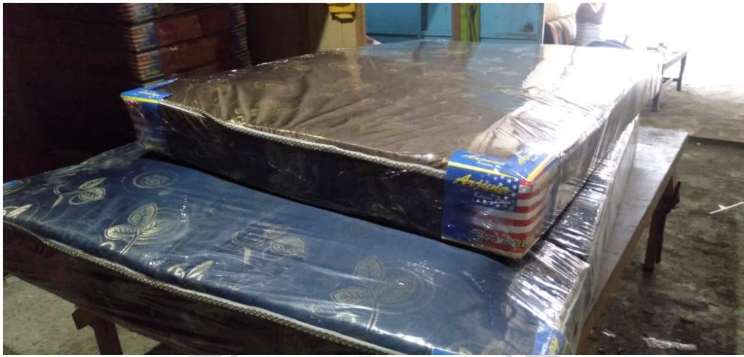
Output Kasur Busa