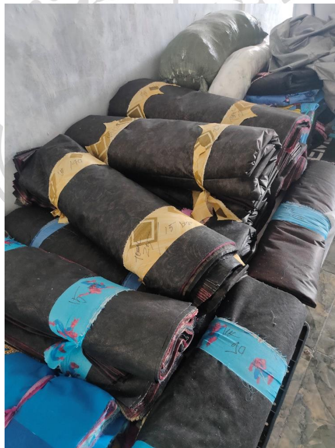
Kain siap dijahit