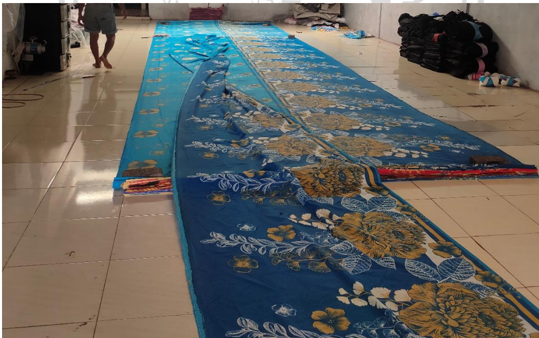
Tempat pemotongan kain