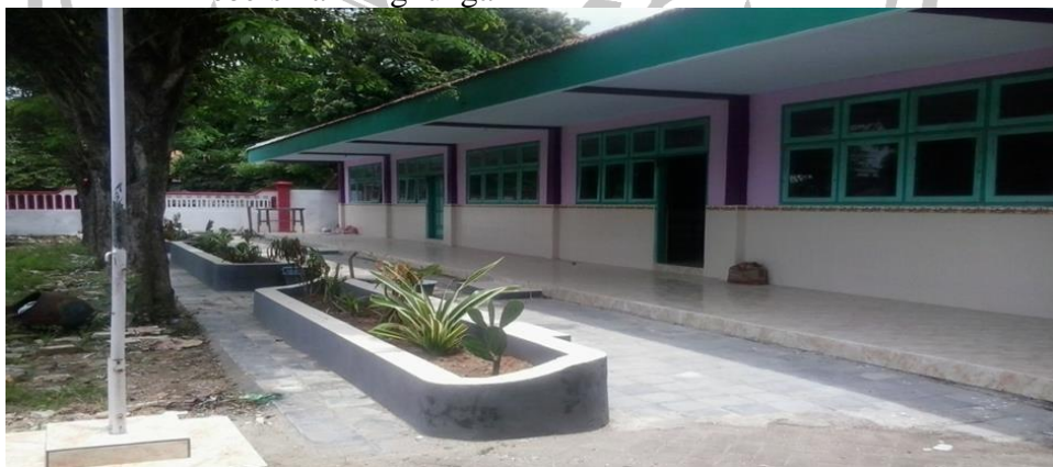
Gambar 2.1 MTs Muhammadiyah 8 Ngimboh