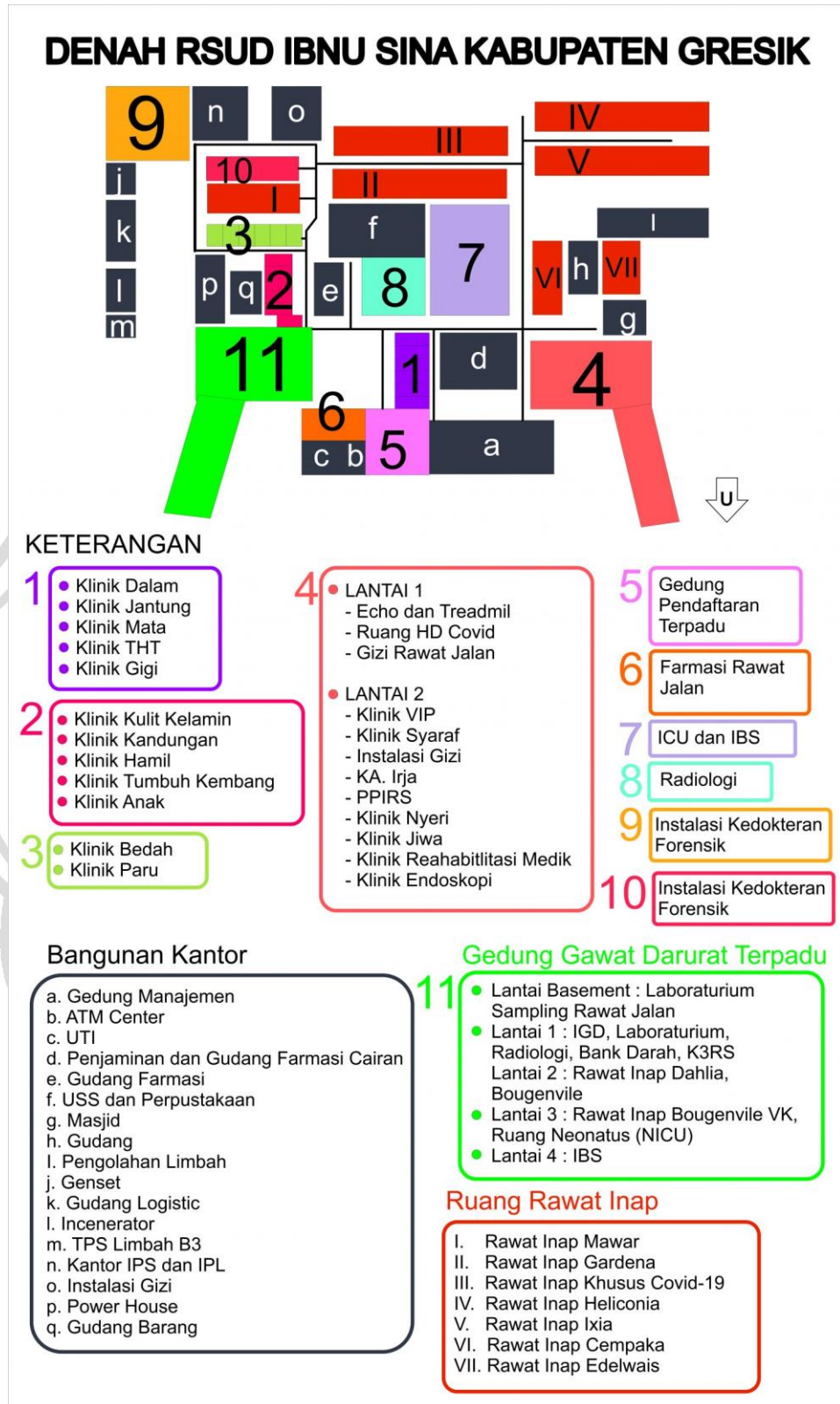
Gambar 2.3 Denah RSUD Ibnu Sina Kabupaten Gresik