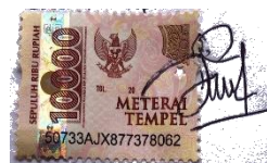
Ahila Nela Fitriya