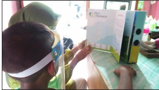
Proses belajar membaca