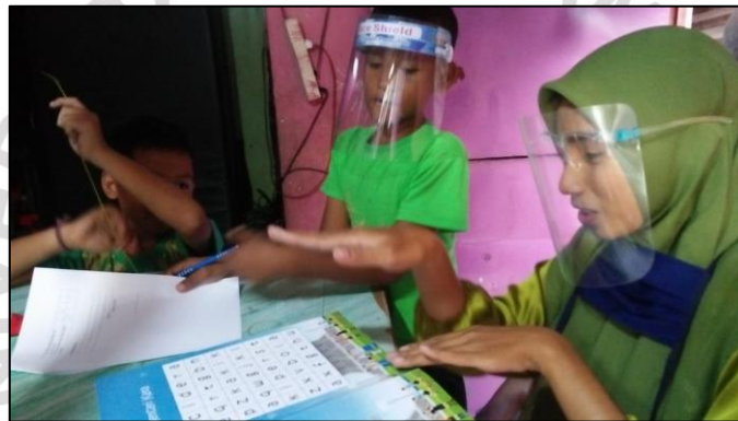
Mecari kata dalam kumpulan huruf