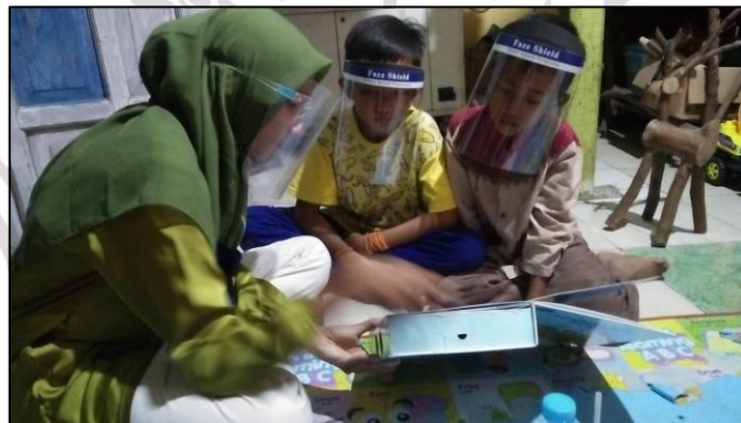
Proses menyimak cerita