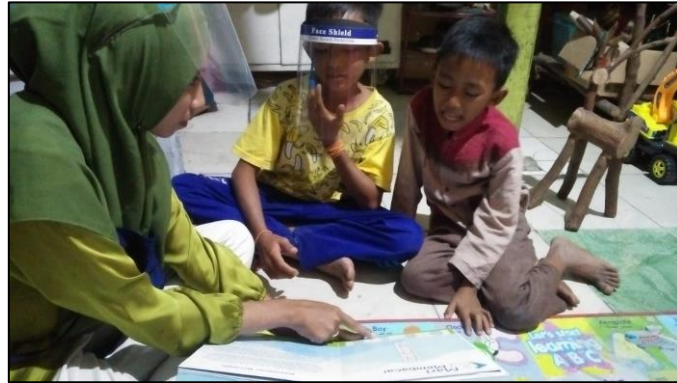
Proses belajar membaca