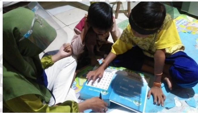
Aplikasi mencari kata dalam kumpulan huruf